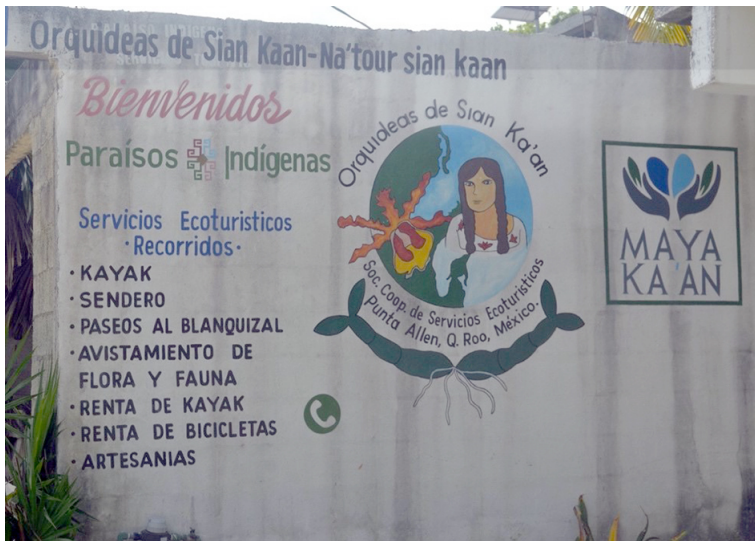
Figura 1. Logo y servicios turísticos que ofrece la cooperativa Orquídeas de Sian Ka'an.

De las ocho cooperativas, la organización de las Orquídeas de Sian Ka'an es la única que está conformada exclusivamente por 8 mujeres, lo cual después de una vista de reconocimiento en verano de 2021 por las diferentes cooperativas, en diciembre del 2021 se llevó a cabo el trabajo de campo (figura 1).