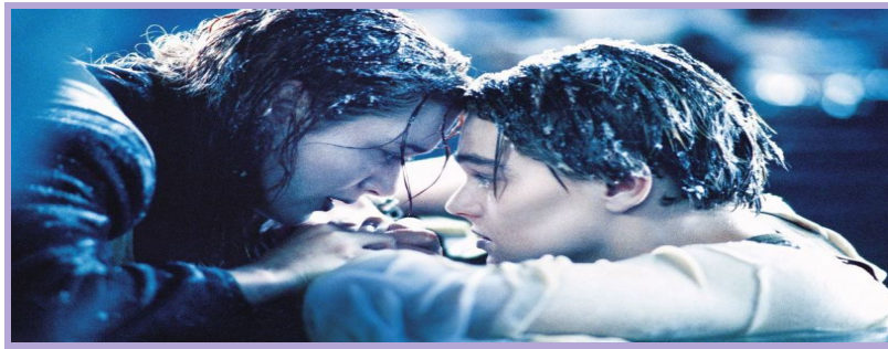
Imagen que se empleó como material para el diseño de los talleres coeducativos. Talleres de de-construcción del prototipo de amor romántico y propuestas para establecer relaciones sanas de parejas.

La finalidad de estos talleres consistió en sensibilizar para el fomento de relaciones sanas de parejas para que pudieran desarrollarlas en sus vidas cotidianas: el autocuidado, la libertad de los espacios privados de cada uno y de su intimidad, la autonomía e integridad, la corresponsabilidad y reparto de tareas, la empatía, el respeto por las diferencias, la equidad de poder en la relación de pareja y la comunicación asertiva.