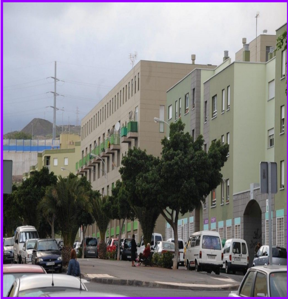
RAMBLA DE AÑAZA. (FUENTES: DIARIO DE AVISOS. 2016).