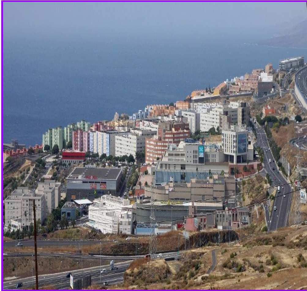
IMAGEN ACTUAL DEL BARRIO DE AÑAZA.

En definitiva el autor resalta que: “Añaza se presenta como un polígono residencial situado junto a la autopista del sur, con capacidad para unos 4.000 viviendas, públicas y privadas, de diferentes tipologías y ocupadas por una población que trabaja en el centro capitalino” . ( ibid : 253)