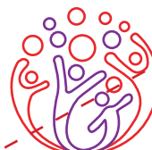
Uso de la marca en línea