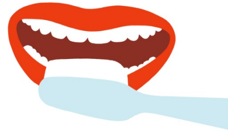
Productos de Asistencia Dental