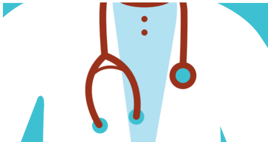
Productos de Asistencia Sanitaria

Y es que en Asisa solo nos importa la salud.