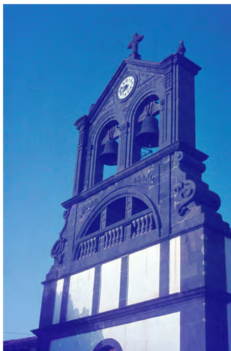
Lámina 9. Villa de Firgas, iglesia parroquial de San Roque, detalle de la fachada (años ochenta, siglo xx).

en los ventanales ojivales. La bellísima espadaña es lo mejor de todo el conjunto, de corte ecléctico con motivos modernistas, evidente en el tratamiento de los temas decorativos vegetales y la inscripción «Año 1924».