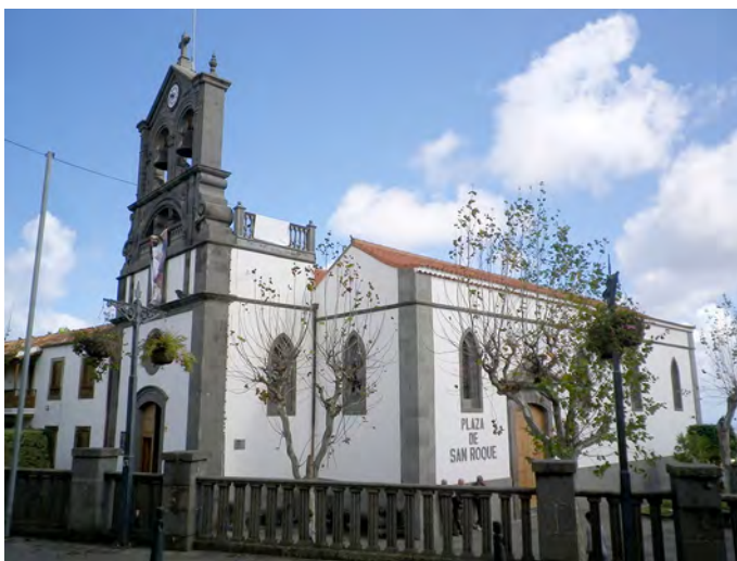
Lámina 7. Villa de Fargas, Iglesia parroquial de San Roque (febrero 2016).