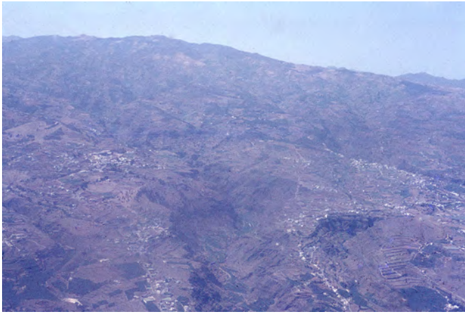
Lámina 1. Municipio de Firgas, vista aérea (años ochenta, siglo xx).