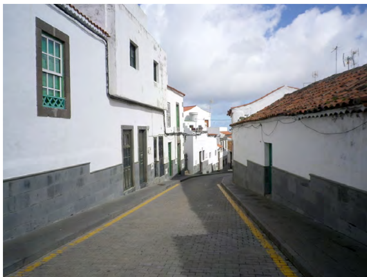
Lámina 6. Villa de Firgas, calle Real (febrero 2016).

de forma definitiva 40 . En ese año el nuevo municipio de Firgas contaba con 1.200 almas 41 . A finales del siglo XIX, la jurisdicción tenía 1.820 habitantes 42 .