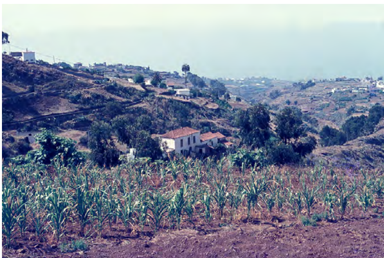
Lámina 5. Firgas, Los Barranquillos (fotografía JSLG, años ochenta, siglo xx).

único caso en Canarias en que una iglesia conventual se convierta en la parroquial matriz de un municipio, pasando de convento a parroquia con cambio de nombre.