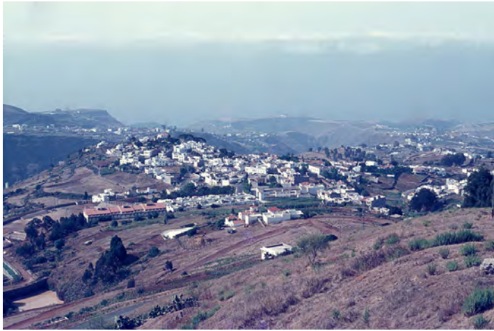
Lámina 2. Villa de Firgas (años ochenta, siglo xx).

de los 17.415 maravedís que se debían por sus servicios en la conquista de la isla 13 ; también estaban Vasco López, al levante de la Caldera de Firgas; Hernando de Bachicao, en la Caldera; Jorge de Zorita, Juan de Escalona, etc. 14 . Otros trapiches eran los de Martín de Adulza, López Sánchez de Palenzuela, etc. 15 .