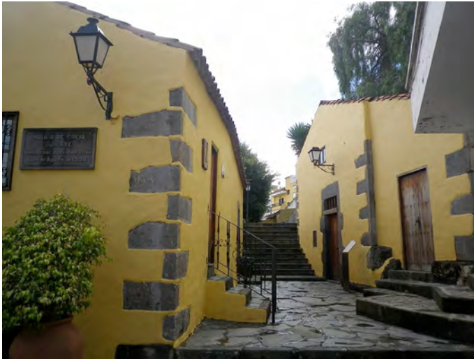
Lámina 3. Villa de Fargas, Molino (febrero 2016).

de Rosales, etc. Estas tierras estaban dedicadas especialmente a la caña de azúcar, cereales (trigo), viñas, así como otros cultivos más generales 22 .