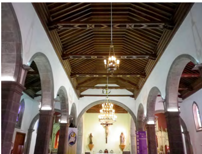
Lámina 8. Villa de Firgas, iglesia parroquial de San Roque, interior.

gas y que aún acompaña a san Roque en la procesión patronal de cada dieciséis de agosto. El misterio del Rosario es la devoción mariana predilecta de los dominicos y así se refleja en todas sus iglesias y lugares donde tuvieron convento, como es el caso de Firgas 49 . San José y san Cayetano (cuya imagen se conserva) también son devociones que vienen del convento.