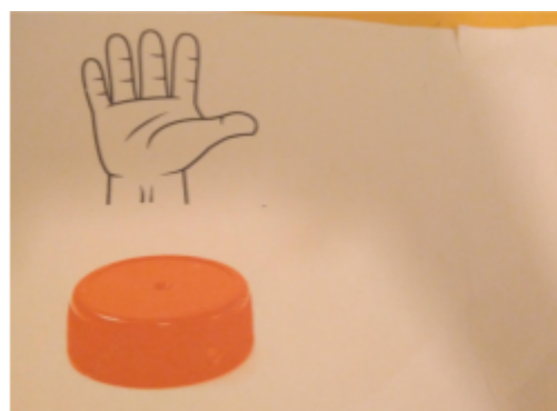
Figura 4. Ejemplo de la actividad 7.

Desarrollo de la actividad: Cada alumno medirá una libreta. Tendrá una ficha en la cual habrá un tabla con el dibujo de una mano y de una tapa. El alumno debe medir, en primer lugar, con las palmas de la mano y anotar en su ficha cuántas palmas mide la libreta, para ello, dibujarán una pequeña línea recta en la ficha según el número que le haya dado en la medición (ver Figura 4). Preguntar: ¿Qué ha pasado? ¿Si la libreta que hemos medido es la misma? A partir de aquí reflexionar que no todas las manos son del mismo tamaño. Comprobar el tamaño de su palmo con el de la maestra. Volver a medir la libreta pero con tapas. Realizar el mismo procedimiento que con las manos, pero con las tapas en la ficha (ver Figura 4).