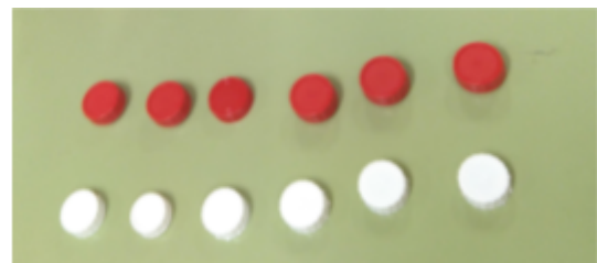
Figura 2. Ejemplo de actividad 2.

Posteriormente, mover las tapas de una de las filas de modo que estén más juntas y que la otra fila quede más corta. Y, preguntar: ¿Ahora hay el mismo número de tapas en las dos filas?