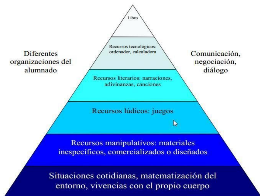
Figura 1. Tipos de actividades matemáticas en Educación Infantil.

Según indica Alsina (2013), existen diferentes tipos de actividades para trabajar las matemáticas con los niños de (3-6 años). El autor realiza un símil entre la pirámide de la alimentación y los tipos de actividades matemáticas (ver Figura 1. Tipos de actividades matemáticas en Educación Infantil ). Se observa que el mayor número de actividades para trabajar las matemáticas tienen que coincidir con situaciones cotidianas de los alumnos. Subiendo en la pirámide aparecen las actividades con uso de recursos manipulativos. Seguidamente, los alumnos aprenden los contenidos matemáticos a través del juego. En menor medida, se plantea la utilización de recursos literarios, tecnológicos y, por último, las actividades con papel y lápiz.