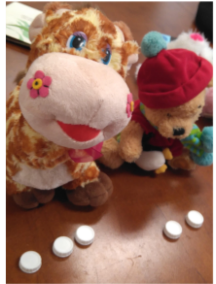
Figura 1. Ejemplo de actividad 1.

Roles: Debido a la disposición de los alumnos, estos tendrán un rol participativo en la actividad. Mientras que la maestra mantendrá un rol motivador con ayuda de los peluches para que los alumnos participen de forma activa.