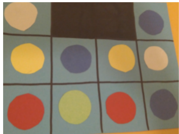
Figura 6. Ejemplo de actividad 13.

Roles: Tanto la maestra como los alumnos tendrán un rol participativo y activo en la actividad.