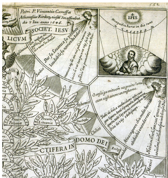
Figura 3. Horoscopium catholicum , esquina superior derecha (Kircher, 1646: Icon. 20).

nacio de Loyola, al pie de un olivo cuyas ramas simbolizan la división provincial de la orden. Por su parte, las cuatro esquinas del grabado están adornadas con 34 frases en otras tantas lenguas, de las que al menos diez reproducen (de forma muy apropiada) el tercer versículo del salmo 113 (112): Desde Oriente hasta el ocaso es venerado el nombre del Señor 2 .