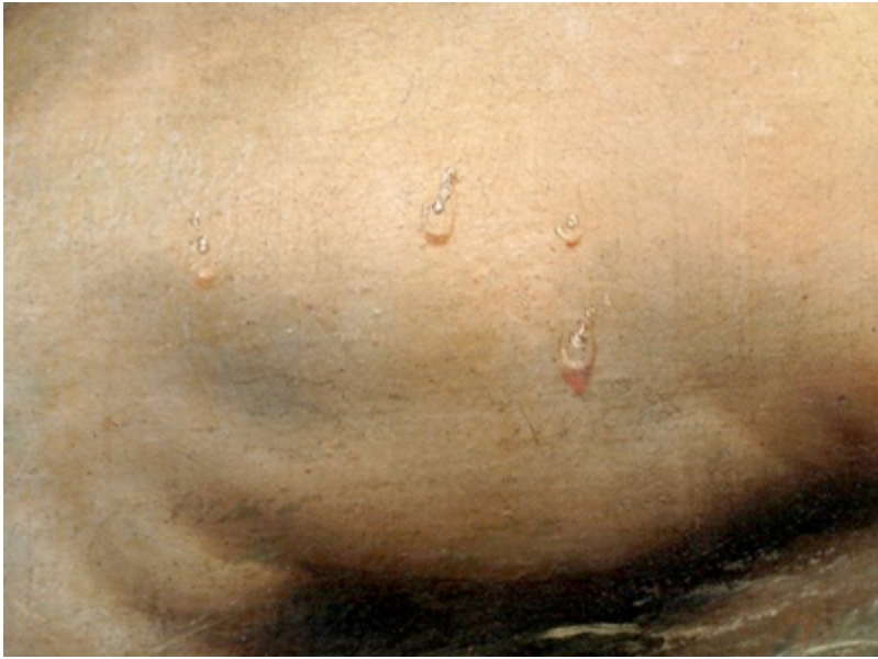
Fig. 3. P.P. Rubens: El desembarco de María de Médicis en Marsella (1622-26, detalle).