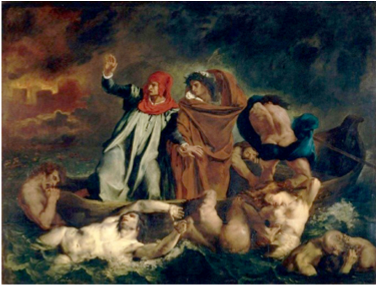
Fig. 1. E. Delacroix: La barca de Dante (1822).