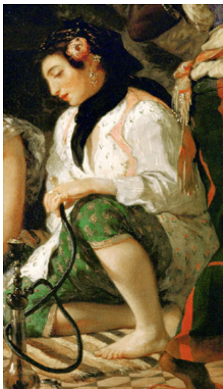
Fig. 5. E. Delacroix: Mujeres de Argel (1834, detalle).

presión visual no depende del hecho de que se trate de una tela imitada con pintura o una tela auténtica, cuyo bordado o estampado, a fin de cuentas, se «superpone» al tejido de fondo de manera semejante a como la pintura se superpone a otra superficie blanca o coloreada, alterando la impresión óptica del conjunto. Si la mezcla óptica fusionase real y perfectamente los dos tonos (el blanco cálido del fondo y el verde de las florecitas) a la distancia adecuada, el resultado sería doble: por una parte, el espectador dejaría de percibir separadamente ambos colores, ya «fundidos» en su cerebro (por ejemplo, si viese el cuadro desde muchos metros y no pudiese determinar la composición cromática exacta de la camisa); por otro, el tono resultante estaría dominado por el tono blancuzco del fondo —que ocupa una superficie muy superior a la del verde— aunque más o menos afectado por la adición óptica de éste, cuya presencia no puede dejar de influir en la tonalidad general del conjunto. La belleza del «tono indefinible» de la camisa a la distancia normal de contemplación del cuadro es, dejando a un lado otros factores menores concurrentes, el producto de la interacción del blanco-amarillento y del verde proyectados separada, distinta y simultáneamente sobre la retina del observador, más o menos como si éste tuviese frente a los ojos una tela de esas características. En cuanto al fracaso del copista