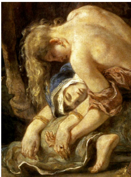
Fig. 6. E. Delacroix: La entrada de los cruzados en Constantinopla (1840, detalle).

la ocasión de ensalzar el tono que resulta de la fusión óptica de los cuatro, cuando lo único cierto es que la intensificación mutua entre estas dos parejas de tintas no exactamente complementarias se verifica justamente porque los punteados tienen el tamaño suficiente para no mezclarse en la retina del espectador a la distancia normal desde la que el cuadro ha de ser observado. Los colores se modifican mutuamente pero en ningún caso se mezclan, ni en el fondo de Van Gogh ni en las telas de las sensuales odaliscas. Camille Mauclair (1872-1945), en fin, en su monografía sobre Delacroix de 1909 pasa por alto la camisa y el pantalón y dirige sus miras a la espalda desnuda de la mujer rubia arrodillada en el primer plano de La entrada de los cruzados en Constantinopla (1840, ML) (fig. 6), resuelta mediante un rayado de anaranjados y azules entrelazados que se unifican a distancia en la retina del espectador (Mauclair 1909, 24) 14 . Incluso en la actualidad, reputados expertos en color pictórico insisten en la versión mitificada de Delacroix como mezclador óptico (Ballas 1997, 61).