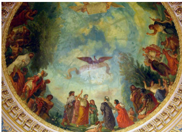
Fig. 4. E. Delacroix: Los espíritus malignos en el Limbo (1840-46).

a distancia, en una palabra, un color resultante , precisamente el que con justeza se llama mezcla óptica (Blanc 1947, 578-579) 9 .