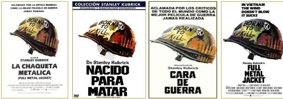
Figura 3. Carteles de Full metal jacket *.

cuando, por ejemplo, se hacen doblajes para un público extenso, o cuando se escribe en internet –red que, inevitablemente, es internacional–. Frente a este léxico, el regional resulta, como lo he llamado, marcado .