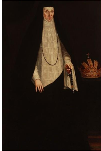
Fig.34. Juan Pantoja de la Cruz, La Emperatriz María de Austria , c. 1600