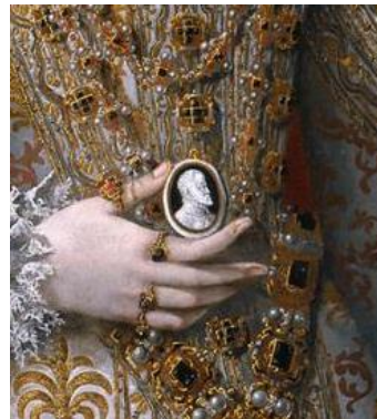
Fig.35. Alonso Sánchez Coello, La Infanta Isabel Clara Eugenia y Magdalena Ruiz (detalle).

La tercera esposa de Felipe II, Isabel de Valois, fue retratada por su amiga y profesora de dibujo Sofonisba Anguissola en 1561 (Fig.36). Sin embargo, hasta hace poco tiempo la pintura se atribuía a Alonso Sánchez Coello y, más tarde, a Juan Pantoja de la Cruz. No obstante, el detallista estudio del rostro de la reina ha permitido afirmar que fue inmortalizada por la italiana. Esta afirmación ha sido reforzada por el hecho de que Isabel de Valois aparece en un paisaje determinado y Sánchez Coello solía colocar las figuras sobre fondos indefinidos. La reina aparece sobre un fondo donde se