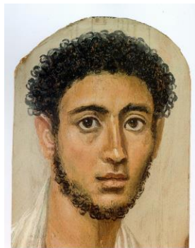
Fig. 2. Retrato de hombre joven de El Fayum

humanas de pequeñas dimensiones, insertas en él, a modo de complemento. Por lo que se desprende, Roma no cultivó el retrato pintado; sin embargo, el Egipto dominado por la cultura grecorromana sí desarrolló un interesante retrato pictórico nacido de la combinación de la pintura funeraria egipcia con el estilo pictórico grecorromano que marcaría las pautas de lo que vendría después en las civilizaciones herederas de la griega y de la romana. El ejemplo más representativo lo constituyen los retratos de momias de El-Fayum (Fig.2), con representaciones de personajes no egipcios y de estilo grecorromano.