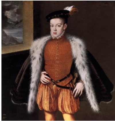
Fig.22. Alonso Sánchez Coello, Retrato del Príncipe Don Carlos , c. 1557

favorecido al efigiado era algo asumido en el medio cortesano (...). 19