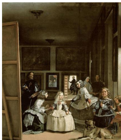
Fig.25. Diego Velázquez, La familia de Felipe IV o Las Meninas , 1656

Pero quizá el paradigma del retrato doméstico en la corte de los Austrias y la obra culmen del pintor sevillano sea La familia de Felipe IV , popularmente conocida como Las Meninas (Fig.25). Aquí aparece la infanta Margarita en el taller del pintor en el instante en el que sus padres entran en la estancia, considerada una obra revolucionaria en muchos sentidos.