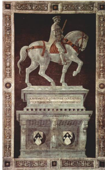
Fig.9. Paolo Uccello, Monumento fúnebre de Sir John Hawkwood , 1436

Los artistas italianos de principios del siglo XVI no se impregnaron tanto de la teoría como los de Europa Central, caso de Alberto Durero. Su carrera artística estuvo condicionada por su intento de adaptar la práctica a la teoría, pero ello no impidió que se convirtiera en una de las principales figuras del Renacimiento centroeuropeo. Autor de múltiples retratos y autorretratos, comienza retratándose a sí mismo y a personas de su entorno personal, utilizando fondos imaginarios o de paisaje. Pero, el ejemplo que más nos interesa destacar en nuestro estudio es el que le hizo a Oswald Krell (Fig.10), donde introduce una pantalla-cortina que se interpone entre el paisaje y el personaje. La presencia de este elemento será una constante en muchos retratos de los Austrias (Fig11).