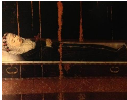
Fig.26.Escuela española, Retrato de infanta Muerta , 1600

Pantoja de la Cruz y Bartolomé González firmaron muchos de estos retratos. En concreto, Pantoja de la Cruz realizó tres de ellos teniendo a la infanta María como protagonista, hija también de Felipe III. La razón por la que se pintaron tres retratos fue porque la intención era enviar dos de ellos a las cortes de Francia y al Sacro Imperio, pues, reforzando la idea de la ambivalencia de estos retratos, aquellos que eran enviados al extranjero desempeñaban una función informativa y, por lo tanto, política. Estos retratos de infantes difuntos repetían el mismo esquema, por lo que se parecían mucho entre sí.