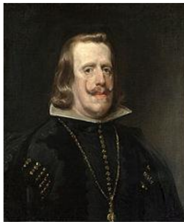
Fig.6. Diego Velázquez, Retrato de Felipe IV , 1656-57