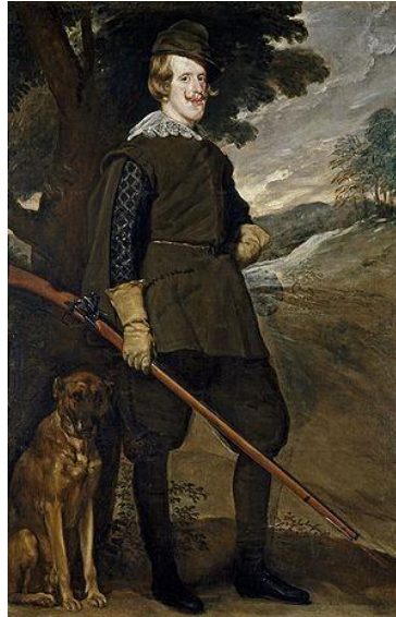
Fig.24. Diego Velázquez, Felipe IV cazador , 1632-34

caracterizado por colores pardos y grises. El rey aparece armado con una escopeta de caza y acompañado por un perro, mostrando una actitud regia, con el gesto serio y uno de los brazos en jarra.