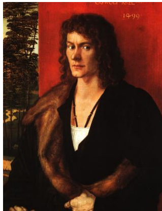
Fig.3. Alberto Durero, Retrato de Osvaldo Krell , 1499

Ese interés por el estudio del hombre ganó fuerza a finales de la Edad Media, lo que culminó en el Renacimiento. Los artistas renacentistas ya contaban con un terreno abonado en materia retratística, pudiendo decantarse por diferentes modalidades: retratos con fondo neutro o de paisaje, de perfil, de frente o de tres cuartos; además de retratos de busto, de pie o ecuestres. Sin embargo, en el Renacimiento no había pintores especializados en retratos, pese a contar con toda esta tipología dentro del género. Uno de los pioneros fue, quizá, Alberto Durero, que añadió a sus composiciones la cortina que separa al retratado del paisaje (Fig.3). Se trata de un elemento introducido por los pintores venecianos que será recuperado en varios retratos de los Austrias españoles.