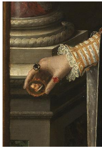
Fig.36. Sofonisba Anguissola, Retrato de Isabel de Valois (detalle).