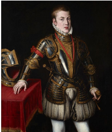
Cristóbal de Morales, El Príncipe don Carlos de Austria , 1562

Este es uno de los objetos más utilizados en los retratos de los Austrias y una de las referencias que nos permiten vislumbrar que estamos ante un retrato español. La mesa es el atributo de la justicia, además de ser un símbolo de autoridad. En los retratos de los Austrias el retratado suele aparecer de pie junto a ella, lo que es indicativo de respeto y autoridad.