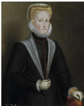
Fig.17. Sofonisba Anguissola, Retrato de Ana de Austria , c. 1575

Lejos de acabar con este modelo ya consagrado en la corte española, dos pintores más tomaron el testigo de Tiziano y Antonio Moro, y fueron Alonso Sánchez Coello y Sofonisba Anguissola. El primero fue discípulo de Antonio Moro en Flandes, llegando a convertirse en pintor de cámara de Felipe II, cuando Moro abandonó España. Demostró su maestría y fidelidad al modelo de retrato imperante con la copia que hizo al de Felipe II realizado por Antonio Moro, y siguió haciendo gala de su talento con los retratos del rey y su cuarta esposa, Ana de Austria, de realización propia. Sofonisba, por su parte, llegó a la corte en 1560 como profesora de dibujo de la reina Isabel de Valois. Con su obra existe cierta controversia, pues ha sido recientemente cuando se ha descubierto que algunas pinturas atribuidas a Sánchez Coello son, en realidad, producto de su pincel. Durante los veinte años que permaneció en España realizó varios retratos entre los que destacan el de Isabel de Valois y los retratos gemelos de Felipe II y Ana de Austria (Figs. 17 y 18).