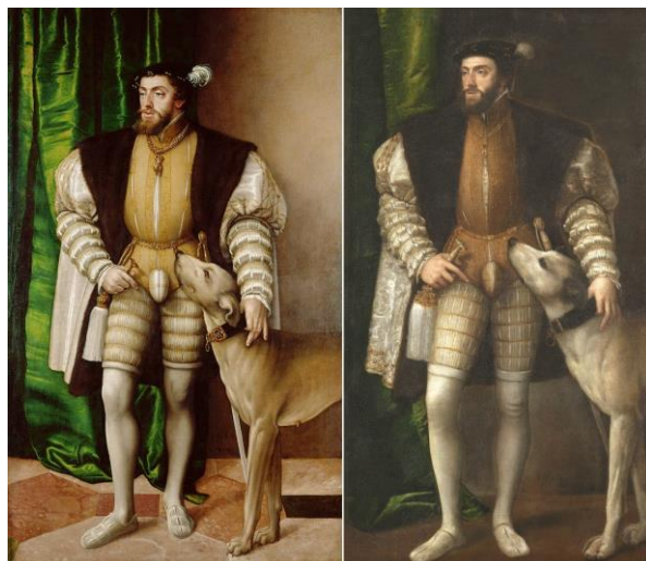
Jacob Seisenegger, Carlos V con perro , 1530

Se trata de un retrato de cuerpo entero, algo nuevo entre los retratos de Tiziano de Carlos V. Desde luego ya antes habían usado Seisenegger y otros pintores alemanes varias veces el formato de cuerpo entero. Pero sin duda, es cierto que le debemos al veneciano la propagación de este tipo, tanto con esta obra, como también con el pintado posteriormente del hijo del Emperador, del Príncipe Felipe. La mirada que evade al espectador diagonalmente, la cabeza en posición tres cuarto, la expresión pensativa, todo esto se une a una presentación del poder, típico del Renacimiento, sobrepasando prototipos de la Edad Media, de clara frontalidad o completamente de perfil, propios de los retratos del final de la Edad Media. 10