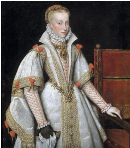
Bartolomé González, La Reina Ana de Austria, cuarta esposa de Felipe II , 1616

La silla hace una clara alusión al trono que solo tenían el derecho a ocupar aquellos que ostentaran el poder. Es uno de los elementos más recurrentes en el retrato de los Austrias, suele aparecer acompañando al rey, a la reina y al heredero, siempre a un lado de la composición y en muchos casos recortada por el marco. Estos personajes aparecen apoyando su mano en ella, como símbolo del poder que ostentan.