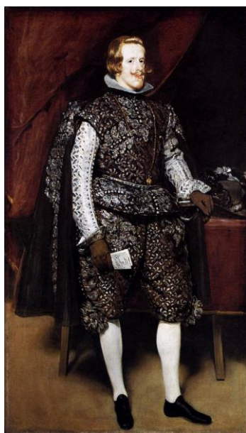
Fig.23. Diego Velázquez, Felipe IV de castaño y plata , 1631-32