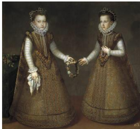
Fig.32. Alonso Sánchez Coello, Las Infantas Isabel Clara Eugenia y Catalina Micaela , c. 1575

Sus hermanas mayores también fueron retratadas por Alonso Sánchez Coello. El retrato de las Infantas Isabel Clara Eugenia y Catalina Micaela (Fig.32), fechado en 1575 se podría considerar infantil solo por el hecho de que aparecen retratadas dos niñas que están a punto de superar la primera década de vida, pero el resto de los elementos presentes, incluso, la postura y sus expresiones nos remite a los retratos cortesanos, pues, aunque pequeñas, ya ostentan un papel importante como futuras mujeres de Estado y se las retrata como tal. Firmado por Alonso Sánchez Coello, aparecen las dos hijas que Felipe II tuvo con su tercera esposa, Isabel de Valois. Este es uno de esos retratos que complica la tarea de diferenciar lo privado de lo público, pues aparecen ataviadas como verdaderas reinas, además hacen alarde del distanciamiento tan propio de los retratos de los Austrias. Parecen figuras geométricas desprovistas de humanidad, pues así era el retrato cortesano de la época que supo reproducir Sánchez Coello en todas sus pinturas de corte. El artista supo conjugar las dos corrientes de la retratística cortesana; las que derivaba de Tiziano, patente en una pincelada más suelta, y la de su maestro Antonio Moro.