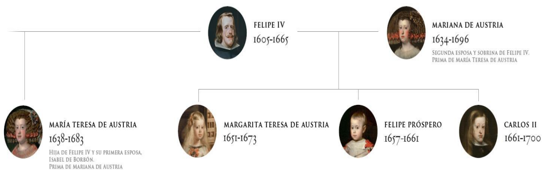
Descendencia de Felipe IV

las tensiones con los Países Bajos y se recrudeció el conflicto contra Francia pese a que intentó resolverlo al final de sus días concertando el matrimonio de su hija María Teresa con Luis XIV, rey de Francia. Quedaban muy lejos ya esos años de esplendor imperial, de influencia y poder, y tocaba ahora conservar los territorios heredados por su padre. Pero sus últimos años también se vieron ensombrecidos por la cuestión sucesoria. Felipe IV se unió en matrimonio, en primer lugar, con Isabel de Borbón, hija de Enrique IV de Francia y María de Médicis. De este matrimonio sobrevivieron a la niñez el príncipe Baltasar Carlos y la infanta María Teresa. El príncipe Baltasar Carlos se convirtió en la gran esperanza de su padre, pero todo se truncó cuando este murió repentinamente a los diecisiete años de edad. A la vista de los acontecimientos, Felipe IV seguía necesitando un heredero por lo que contrajo matrimonio con Mariana de Austria, hija del emperador del Sacro Imperio Romano Germánico Fernando III y María de Habsburgo, hermana del propio Felipe IV. Por lo tanto, este monarca se casó con su sobrina, por lo que no debe extrañar que solo dos de los muchos hijos que tuvieron sobrevivieran a la infancia. Estos fueron Margarita Teresa y el futuro Carlos II, en este último confluyeron las nefastas consecuencias de todos estos matrimonios negligentes.