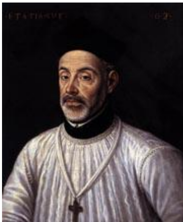
Alonso Sánchez Coello, Retrato de Diego de Covarrubias, 1574

A finales del siglo XVIII, el clásico retrato español comenzó a sentir tímidamente las influencias foráneas, hecho que culminó con la inauguración de la dinastía Borbónica en el trono español con Felipe V, que acabó casi inmediatamente con el tipo de retrato que se venía cultivando anteriormente. Sin embargo, se mantuvo fiel a sí mismo durante casi dos siglos dejando verdaderas obras maestras donde primaba el carácter grave, solemne y contenido; donde el negro de etiqueta en la vestimenta era casi una constante, no siendo necesario colocar una corona o cualquier otro atributo de la realeza, en definitiva, donde solo bastaba la presencia real para rezumar autoridad y poder.