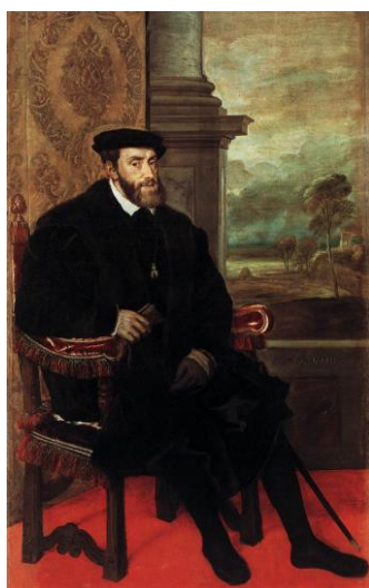
Tiziano, Retrato de Carlos V , 1548

Las columnas que, reiteradamente, aparecen en los retratos de los Austrias aluden a la columna de Hércules, pues, como ya se ha indicado anteriormente, esta familia entronca sus raíces con este personaje mitológico. Además, las «columnas de Hércules» hacen referencia a un lugar, pues, según Diodoro Sículo Hércules recorrió la Libia hasta el Océano que baña Gades (Cádiz), y levantó dos columnas sobre las orillas de uno y otro continente 27 . Se refería a los montes de Ceuta y Gibraltar separados por el Estrecho de Gibraltar, representación del límite entre el Viejo y el Nuevo Mundo, límite para muchos infranqueable y que el Emperador Carlos V fue capaz de superar con el dominio de las Indias de Castilla. Por este motivo pasaron a convertirse en la divisa del Emperador y en elemento recurrente en los retratos, pues su presencia simbolizaba su relación con el semidios y el dominio sobre un gran imperio.