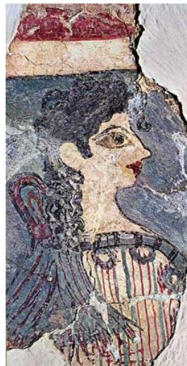
Fig.1. La Parisina

El retrato nacido en Egipto no encontró eco en Mesopotamia, sino en Creta. Sin embargo, los cretenses no desarrollaron un arte funerario, ni siquiera religioso, sino un arte más terrenal que debía dirigirse hacia el retrato, destacando las figuras femeninas como la Parisina (Fig.1). En general, eran damas de la corte vestidas y peinadas con suma elegancia. Sin embargo, la Grecia clásica, aunque tomó elementos artísticos minoicos y micénicos heredados de los cretenses, no presentó una tendencia hacia el retrato. Es por lo que este género, aún en pañales, tuvo que sobrevivir y evolucionar al margen del mundo griego, encontrando un ámbito de desarrollo en Etruria, donde, de nuevo, volvió a cultivarse la pintura funeraria en las paredes de los sepulcros, mostrando al difunto en banquetes y bailes que deseaban celebrar en la otra vida.