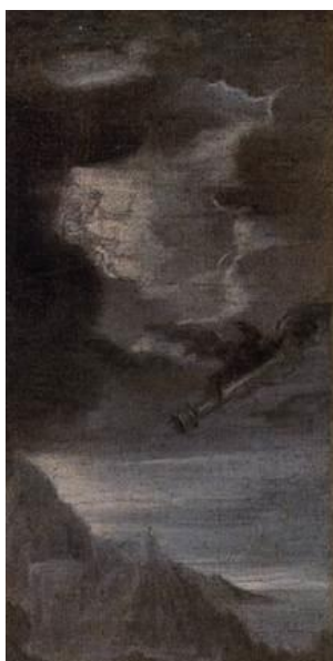
Fig.21. Alonso Sánchez Coello, Retrato del Príncipe Don Carlos (detalle), c. 1557