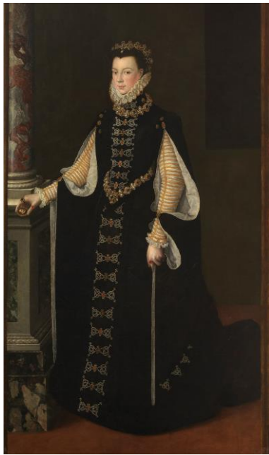
Fig.36. Sofonisba Anguissola, Retrato de Isabel de Valois , 1561

vislumbra una ventana y se coloca al lado de una columna, elemento atribuido en estos retratos a la figura de Hércules y, por lo tanto, al poder que ostentaba, sujetando con su mano derecha una miniatura con la imagen de su esposo, simbolizando su total entrega y sumisión a su esposo y a su país.