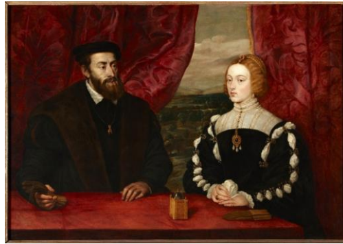
Fig.11. Pedro Pablo Rubens, copia de Tiziano, Retrato de Carlos V y su esposa Isabel de Portugal , 1628-29

No obstante, a pesar de esta expansión, siguió dándose la controversia de los retratos dentro de la pintura religiosa o de historia. Los protestantes, iconoclastas, admitieron el retrato laico, promoviendo el retrato de corte. En cambio, las crisis pietistas en el seno del mundo católico hacen necesaria la separación definitiva del retrato de contemporáneos en los frescos y en los cuadros religiosos. Convirtiéndose ahora exclusivamente el retrato en un cuadro independiente, de caballete, que por su condición portátil puede ser regalado o enviado a otro lugar, por ejemplo para concertar un enlace matrimonial, práctica muy común en la política matrimonial llevada a cabo por los Habsburgo. Esta tipología se difundió rápidamente, llegando a Flandes, donde los artistas, apoyados por una larga tradición, se encargaron de propagarlo, llegando incluso alguno de ellos a abandonar su tierra natal en busca de fortuna. Tal es el caso de Antonio Moro, que llegó a España a mediados del siglo XVI y consiguió retratar a varios miembros de la familia real. Los que no emigraron prosperaron como pintores de cortes de Margarita de Austria y María de Hungría, familiares directos del emperador Carlos V.