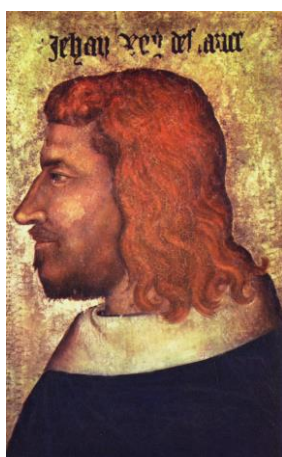
Fig.4. Anónimo, Juan II el Bueno , 1350

Los herederos de este rey francés continuaron con el modelo de su predecesor, tomando luego el testigo los pintores italianos y los flamencos cuando, en la primera mitad del siglo XV, aparecen en esta zona los primeros ejemplos de retratos de caballete. Sin embargo, estos maestros italianos y flamencos imprimieron, en cada una de las zonas, sus propios gustos y preferencias. De este modo se fue generando una distancia entre ellos dando como resultado tipos de retratos diferentes. Tres son los ejemplos que pueden utilizarse para mostrar el punto de arranque de estos tres centros artísticos europeos con respecto al “retrato libre”: el retrato de Luis II de Anjou de 1415 (Francia), el Retrato de un desconocido (Massaccio, 1425) y Retrato de hombre (Jan Van Eyck, 1433) 5 . Es aquí donde empieza a vislumbrarse el marcado gusto de los flamencos por el naturalismo, tendencia que los aleja de italianos y franceses.