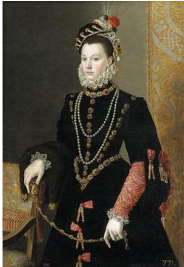
Pantoja de la Cruz, Isabel de Valois , c. 1604-08