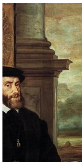
Tiziano, Retrato de Carlos V (detalle).