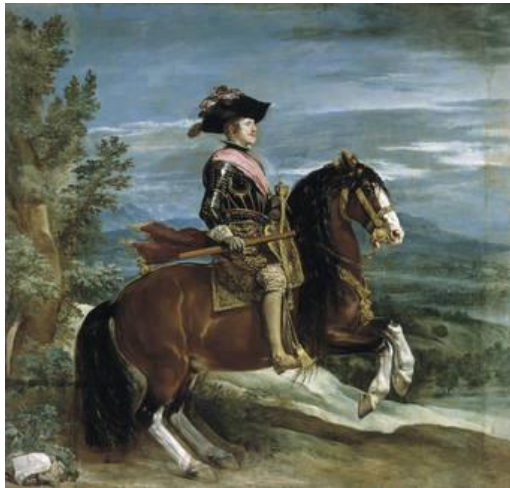
Fig.27. Diego Velázquez, Felipe IV a caballo , 1634-35