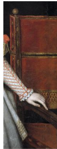
Bartolomé González, La Reina Ana de Austria, cuarta esposa de Felipe II (detalle).