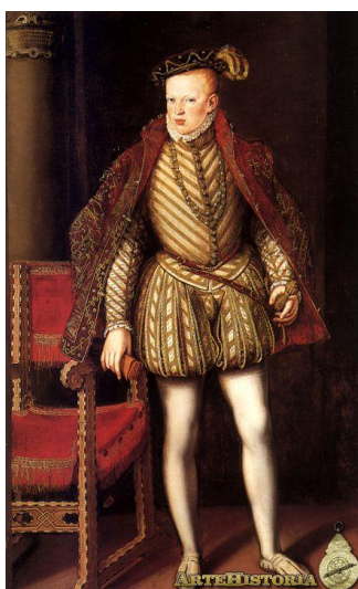
Fig.14. Cristóbal de Morales, Retrato de Don Sebastián de Portugal , 1565

Una vez establecidas las diferentes funciones, será necesario tenerlas en cuenta a la hora de hablar de las tipologías, pues, como se apuntó antes, un retrato que a priori podría considerarse de carácter doméstico por sus atributos e iconografía, fácilmente puede transformarse en un retrato de aparato por la función que cumple, lo mismo podría ocurrir con los retratos oficiales.