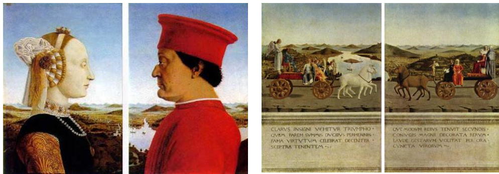
Fig.8. Piero della Francesca, Triunfos de Federico de Montefeltro y Battista Sforza , 1472

El siglo XV acaba tras haberse establecido todas estas tipologías. Ahora, quienes cultiven este género pueden elegir en materia de fondo, de colocación del rostro o, incluso, si solo pintaran un busto o un retrato de pie. Además, con el fresco de Paollo Ucello de John Hawkwood (Fig.9), cuentan, además, con otra tipología: el retrato ecuestre. No obstante, a pesar de esta expansión, el retrato siguió siendo un género de segunda clase y pocos pintores los firmaban. Esto ocurría porque, en la mayoría de los casos, éstos eran fruto de la relación que se establecía entre el pintor y el comitente, como frescos o cuadros de altar. De modo que el retrato pasó desapercibido y se mantuvo al margen de los tratados de pintura del siglo XV. Además, no existían pintores que se dedicaran exclusivamente a la retratística, sino que este género formaba parte del amplio abanico de géneros que cultivaban.