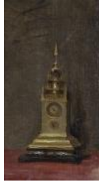
Diego Velázquez, Mariana de Austria, reina de España (detalle).