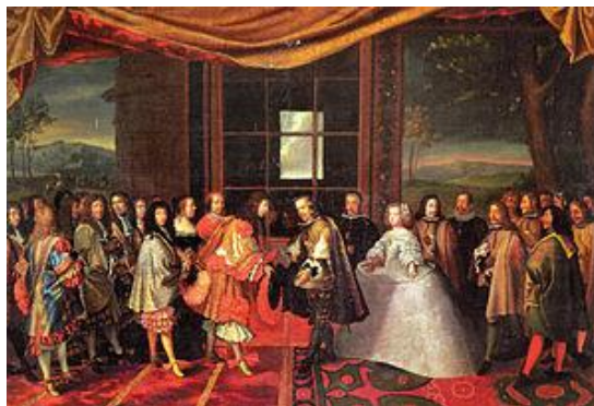
Fig.37. Laumosnier, La Paz de Los Pirineos , 1659

La distancia a todos los niveles que separaba a la corte española de la francesa era más que evidente. El retrato francés había seguido un camino muy diferente al español, como ya apuntamos en su momento. Ese gusto tan dispar ya se manifestó en un cuadro de Laumosnier conocido con el nombre de La Paz de los Pirineos (Fig.37), donde aparece el encuentro entre Felipe IV de España y Luis XIV de Francia en la Isla de los Faisanes, frontera entre los dos países y en él se evidencian los diferentes gustos en el uso del vestir que se daban en ambas cortes.