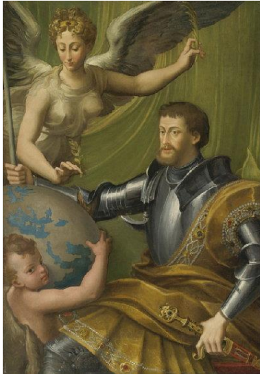
Parmigianino, El Emperador Carlos V recibiendo el mundo , 1529-30