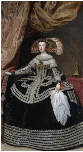
Diego Velázquez, Mariana de Austria, reina de España , 1652-53