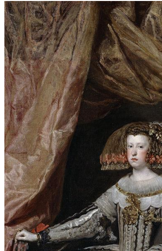
Diego Velázquez, Mariana de Austria, reina de España (detalle).