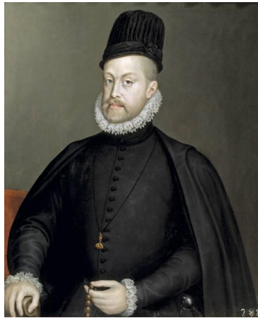
Fig.20. Sofonisba Anguissola, Retrato de Felipe II , c. 1575

dimensión espiritual y psicológica de los mismos. Todo ello, ejecutado siempre, con una pintura suave y lumínicamente sensible. 18