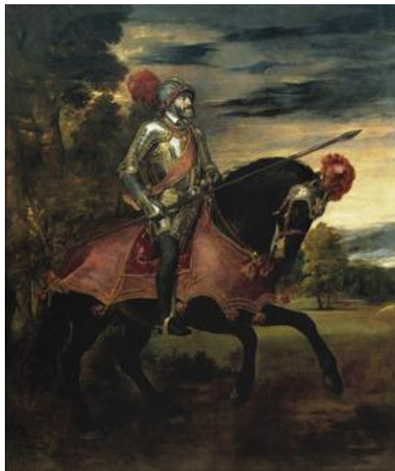
Fig.16. Tiziano, Carlos V en la batalla de Mühlberg , 1548

Todo este proceso culminó con el retrato de Carlos V en la batalla de Mühlberg , retrato ecuestre pintado por Tiziano Vecellio en 1548 (Fig.16), cuando se encontró con el emperador en Augsburgo. Este modelo contenido y sencillo se perpetuó en la imagen de poder a lo largo del Quinientos y durante la centuria siguiente, y sorprende por el hecho de que los hombres más poderosos de Europa se decantaran por hacer ostentación del poder de una manera tan sutil, de ahí la complejidad que se presenta a la hora de clasificar estos retratos e identificar aquellos que se realizaron pensando en mostrar a los reyes como tales.