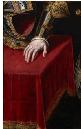
Cristóbal de Morales, El Príncipe don Carlos de Austria (detalle).