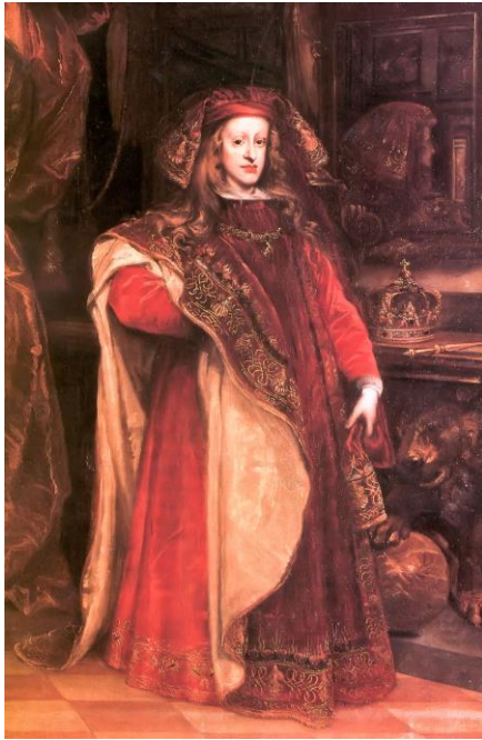
Juan Carreño de Miranda, Carlos II con el manto de la Orden del Toisón

La corona de reyes y emperadores está hecha con oro y, en ocasiones, puede presentarse adornada por piedras preciosas y, aunque la corona no solo remata la cabeza de reyes, sino también la de papas o héroes militares, se ha convertido en el símbolo de la realeza por antonomasia. No obstante, este elemento no es el que más se repite en los retratos de los Austrias, pues la austeridad que los caracterizaba los privaba de este objeto que era, ante todo, un elemento de rotunda majestuosidad.