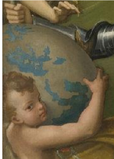
Parmigianino, El Emperador Carlos V recibiendo el mundo (detalle).

4.4.- El retrato de los Austrias vs retrato de los Borbones. Un antes y un después en el retrato de poder en España.