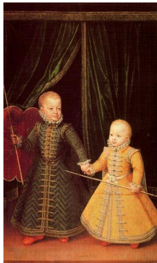
Fig.31. Alonso Sánchez Coello, Infantes Don Diego y Don Felipe , 1579

Dentro de esta tipología destaca el retrato de Los Infantes Don Diego y Don Felipe , fechados en 1579 (Fig.31). Este retrato doble firmado por Alonso Sánchez Coello muestra al Infante Don Diego, cuando todavía era el heredero, y al Infante Don Felipe, proclamado rey de España a la muerte de su padre en 1598. Ambos son fruto del matrimonio de Felipe II con su sobrina Ana de Austria. Cuando fueron retratados contaban solo con cuatro y un año, respectivamente. La banda oscura de la parte inferior sugiere que se encuentran sobre una plataforma y ambas figuras aparecen recortadas sobre una cortina verde. Los colores predominantes son el verde, rojo y amarillo. Los niños posan de modo artificioso y poco natural, pues aunque sean pequeños no debemos olvidar que pertenecen a la familia real. El mayor de los hermanos presenta en su rostro los rasgos característicos de los Habsburgo, y además tiene una fuerte carga simbólica porque sostiene con la mano izquierda la de su hermano pequeño, mientras que con la derecha sujeta una suerte de escudo y una caña, pues con ello hace alarde del virtuoso comportamiento que debía mostrar un rey.