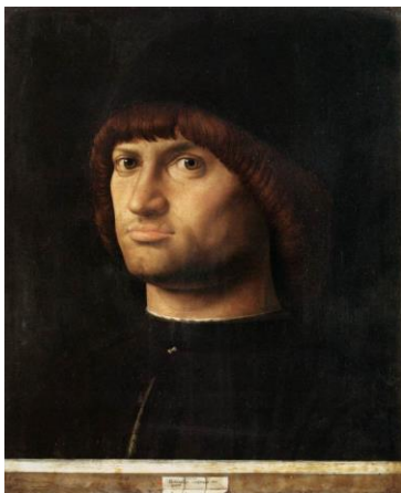
Fig.5. Antonello da Messina, El Condottiero , 1475