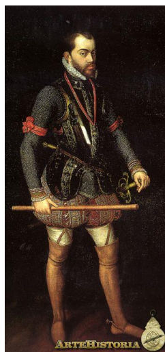
Fig.19. Alonso Sánchez Coello, Felipe II , 1566

Felipe II siguió los pasos de su padre, como ya se apuntó, haciéndose retratar siguiendo el mismo modelo. Uno de sus retratos más destacados es el que consta en un inventario de El Escorial de la siguiente manera: Un retrato entero del Rey Don Phelippe nuestro Señor armado, con mangas de malla y coselete con un bastón en la mano y banda roja, con botas y espuelas y calças blancas de pincel y sobre lienzo de mano de Antonio Moro. Es retrato de la manera que andava quando la guerra de Sant Quintin 15 . En este retrato, firmado por Antonio Moro (Fig.19) el rey aparece de cuerpo entero con piernas en compás y media armadura, vestimenta que lucía en la batalla de San Quintín.