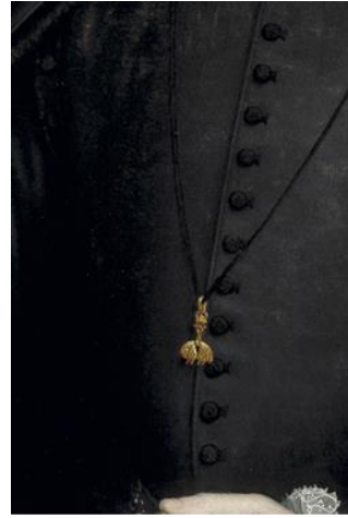
Sofonisba Anguissola, Felipe II (detalle).