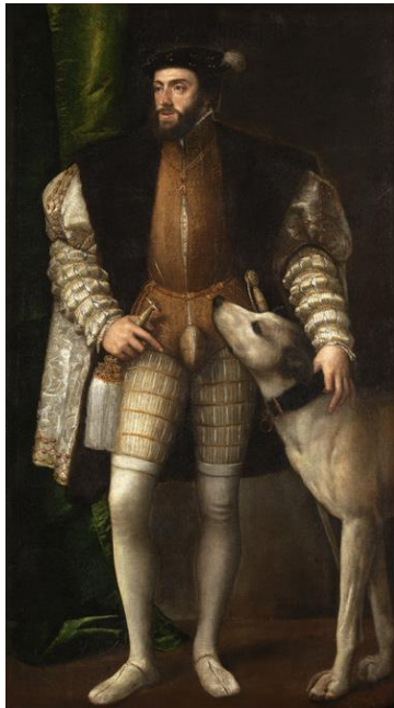
Tiziano, Carlos V con perro , 1532-33

El retrato que se puede considerar como punto de partida de los retratos de la Casa de Austria es el que Tiziano ejecutó del emperador Carlos V con un perro en 1533. No solo estableció las bases de los retratos reales que se realizarían a posteriori , sino que también introdujo la figura del perro. Este animal aparece casi en exclusiva en los retratos reales, nada extraño al significar la fidelidad y el honor en la palabra. Pero no solo aparece aludiendo a esta virtud, pues el perro también es imprescindible en la actividad cinegética. De esta manera, será habitual verlo en aquellos retratos al aire libre que muestran al rey o a algún otro miembro de la familia real ataviado con la indumentaria de caza, armado con una escopeta y acompañado por su perro. Esta tipología, como veremos posteriormente, ganó fuerza y calidad artística en manos de Diego Velázquez, pintor que no descuidó el tratamiento del animal a pesar de ser un elemento iconográfico más.