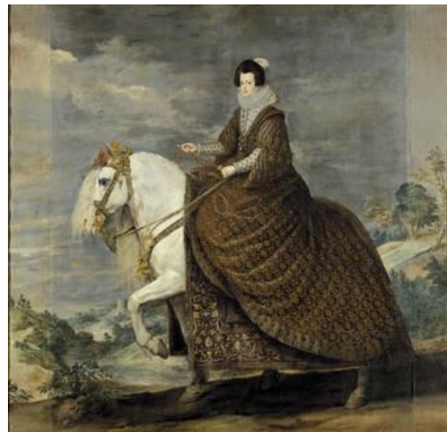
Fig.28. Diego Velázquez, Isabel de Borbón a caballo , 1634-35