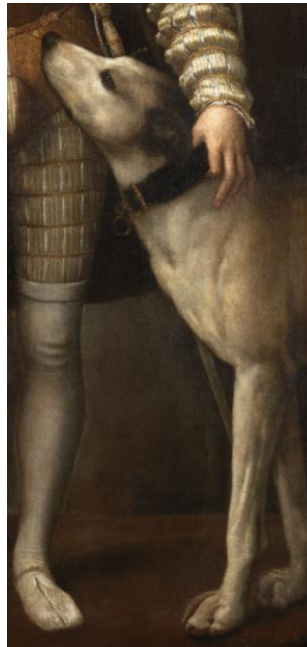
Tiziano, Carlos V con perro (detalle).