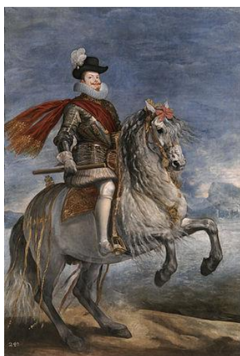
Fig.13. Diego Velázquez, Retrato ecuestre de Felipe III , 1634-35

Además, los retratos de aparato también cumplen una función sustitutoria, es decir, el retrato suple la ausencia del retratado, cuestión que gana fuerza cuando se trata de un rey. De manera que cuando no se contaba con su presencia se colocaba su retrato, que se ocultaba, cuando el rey hacía acto de presencia. También cumplía una función transcendental cuando un nuevo monarca accedía al trono, ya que a través de su imagen se pretendía acercarlo a los súbditos.