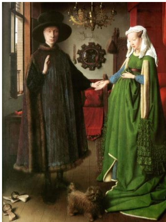
Fig.7. Jan Van Eyck, El matrimonio Arnolfini , 1434

Sin embargo, este retrato de fondo neutro llegaba a resultar algo austero, por lo que no tardó en aparecer otro tipo que colocara al ser humano en un marco físico, ya fuese en un interior o superpuesto sobre un paisaje. Estas dos tipologías se desarrollaron paralelamente en el continente. Y fue Van Eyck, de nuevo, el que marcó el camino a seguir con su tabla de El matrimonio Arnolfini (1434) (Fig.7). Con esta obra maestra supo establecer un equilibrio entre los retratados y el escenario, de modo que la habitación no engullera a las personas apartándolas a un segundo plano. Así pues, los pintores flamencos volvieron a mirar hacia dentro, proliferando los retratos situados en interiores.