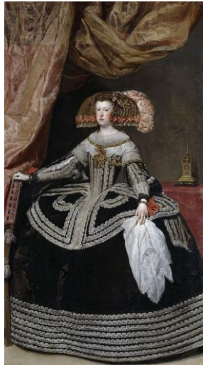
Diego Velázquez, Mariana de Austria, reina de España , 1652-53