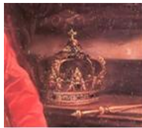
Juan Carreño de Miranda, Carlos II con el manto de la Orden del Toisón (detalle)