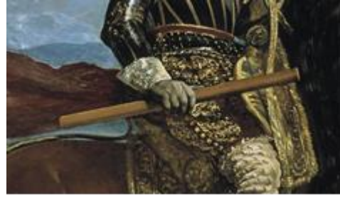
Diego Velázquez, Felipe IV a caballo (detalle).