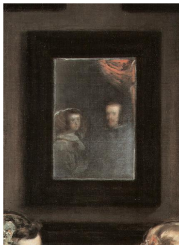
Diego Velázquez, La familia de Felipe IV o Las Meninas (detalle), 1656

Se trata de un objeto al que se recurre para aludir a la verdad, pues refleja lo real, no engaña. No obstante, también hace referencia a la virtud de la prudencia, pues reflejarse en la superficie de un espejo permite observarse a uno mismo y ejercer el autocontrol. Así pues, si aparece un espejo en un retrato, en la mayoría de los casos, aludirá a las virtudes de la verdad y de la prudencia que caracterizan la personalidad del retratado.