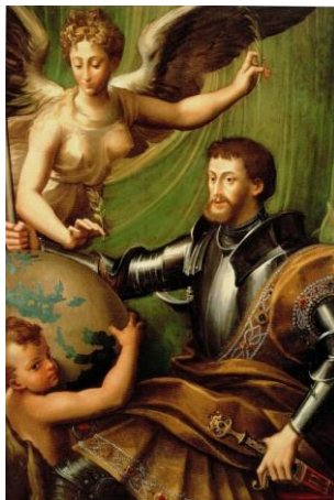
Fig.15. Parmigianino, El emperador Carlos V recibiendo el mundo , 1529-30

primero salió de la mano de Parmigianino (Fig.15). Se trata de un retrato con una notable carga alegórica, porque muestra al rey en los primeros años de su reinado, vestido con la armadura de caballero y acompañado por Hércules, pues los Austrias entroncaban sus raíces dinásticas con la de este personaje mitológico para justificar su grandeza. Hércules, caracterizado como un niño, porta un globo terráqueo que ofrece al monarca, simbolizando así su posición dominante sobre el mundo. Pero el aspecto alegórico no acaba con la figura del semidios, sino que en la esquina superior izquierda aparece la personificación de la Fama portando una corona de laurel, símbolo victorioso. Este retrato ejemplifica a la perfección el tipo italianizante al que antes hacíamos mención.