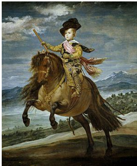
Fig.29. Diego Velázquez, El Príncipe Baltasar Carlos a caballo , 1634-35