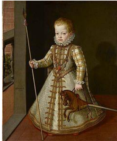
Fig.30. Alonso Sánchez Coello, Infante Don Diego , 1577

de ellos los niños portan juguetes que simbolizan los elementos que solían acompañar los retratos de sus padres. Así podemos ver cañas que aluden al bastón de mando o caballos de juguete que simbolizan el carácter guerrero que debe tener un rey, como ocurre en el retrato del Infante Don Diego de Alonso Sánchez Coello (Fig.30), que fue retratado con un caballito de juguete alusivo a su futuro como general.