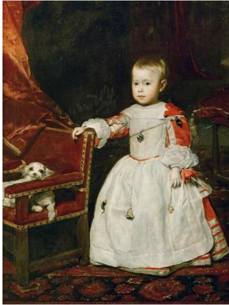
Fig.33. Diego Velázquez, Retrato del Príncipe Felipe Próspero , 1659