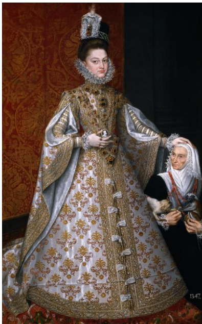
Fig.35. Alonso Sánchez Coello, La Infanta Isabel Clara Eugenia y Magdalena Ruiz , c. 1585-88

Este recurso se convirtió en recurrente en los retratos del reinado de los Austrias persiguiendo siempre el objetivo de parecer más esbeltos, elegantes y distantes. En este caso, la atribución a Alonso Sánchez Coello ha sido tardía, incluso una vez afirmado surgen dudas en cuanto a una serie de detalles como el tratamiento de la vestimenta o de las manos, pues por esa fecha Sánchez Coello hacía uso de una técnica más suelta. Incluso se cree que pudo haberse acabado por los ayudantes del taller, tras la muerte del pintor.