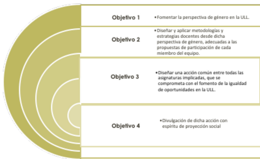
Figura 1. Objetivos específicos del Proyecto Feminario ULL

Las propuestas individuales se querían subrayar como accesibles y fáciles de incorporar en las guías docentes, en las prácticas, en la interrelación en el aula, y flexibles a los contenidos y materias. Las asignaturas participantes finalmente fueron: Relación Familia Escuela, Sociología de la Población, Sociología, Psicología para Trabajo Social II, Interpretación del Patrimonio Geográfico, Derecho Privado, Entornos virtuales Enseñanza-Aprendizaje, Sistemas de Interacción Persona-Computador. En total, estas ocho asignaturas implicaron a siete grados muy diferentes entre sí, de distintas ramas y áreas de conocimiento: Grado de Pedagogía, Grado de Psicología, Grado de Sociología, Grado de Ingeniería Informática, Grado de geografía e Historia, Grado en Turismo, Grado de Maestro Educación Infantil. Asimismo, las Facultades o Centros finalmente implicados fueron cuatro: Facultad de Educación, Facultad de Ciencias Políticas, Sociales y de la Comunicación, Máster en Ed. y TIC, Escuela de Ing. Informática, Facultad de Economía, Empresa y Turismo.