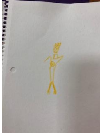
Ilustración 2 Representación de sí misma embarazada