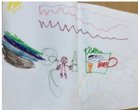
Ilustración 3 Dibujo de la sesión donde se utilizó una taza de juguete para darle una sopa