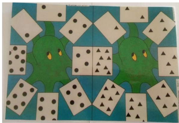
Figura 4. Tablero del juego del Pulpo.

- Juego del Pulpo : para este juego, se requiere 16 cartas con los números del 1 al 8 y un tablero (Figura 4). Este último, tiene dos partes que representan dos pulpos y, cada tentáculo del pulpo tiene una cantidad de puntos o triángulos del 1 al 8. Las cartas se mezclan y se colocan boca abajo y cada jugador completa un pulpo. Cada jugador coge por turno una carta y la pone en la posición correcta en su lado del tablero. Si el lugar ya está ocupado, la carta se vuelve a poner con el resto. Cuando el jugador no pueda poner una carta, el turno pasa al otro. El ganador es el primer jugador que complete el pulpo.