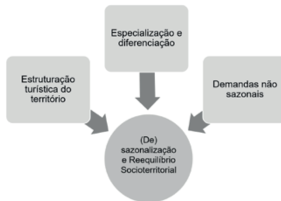
Figura 05: Diretrizes para a (de)sazonalização e ao reequilíbrio socioterritorial;

A seguir, são apresentados três temas relevantes apontados pelo documento do Plano de Turismo Espanhol Horizonte 2020 como diretrizes essenciais à investigação e estudo referente à (de)sazonalização e ao reequilíbrio socioterritorial de um destino turístico: