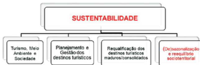
Figura 04: Eixo de desenvolvimento da atividade turística