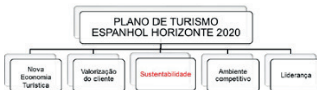
Figura 03: Eixos de desenvolvimento da atividade turística;