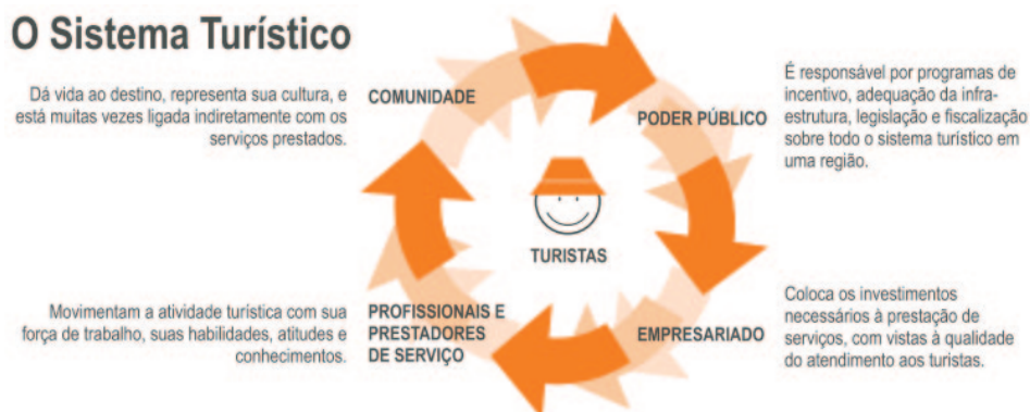
Figura 02: O Sistema Turístico