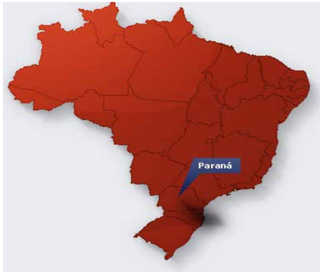
Figura 1: Mapa do Brasil com destaque para o Estado do Paraná