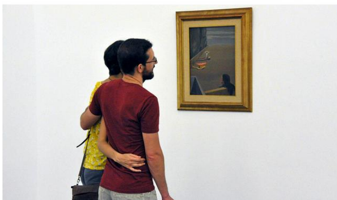
Hasta 51 artistas piden más atención a las aportaciones de las mujeres a la historia del arte en Canarias. DA