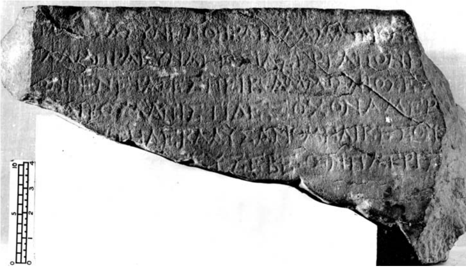
Figura 3. Fotografía del Fitzwilliam Museum (Negative No.: FMS.25).