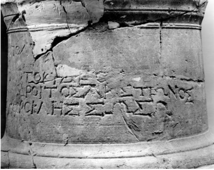
Figura 6: Inscripción 2.B (3).