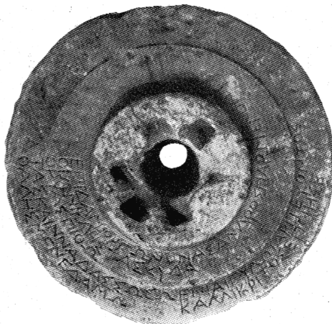
Figura 3: Inscripción 2.A (Guarducci).