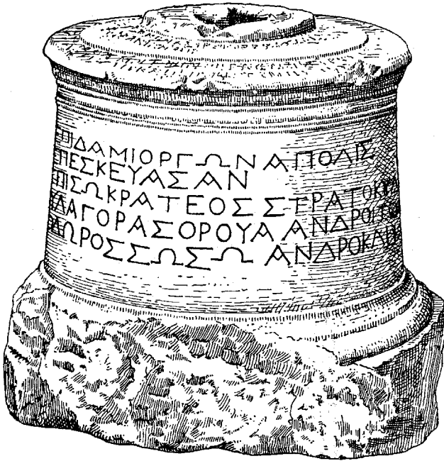
Figura 7: Inscripción 2. Copia del monumento de L. Savignoni.