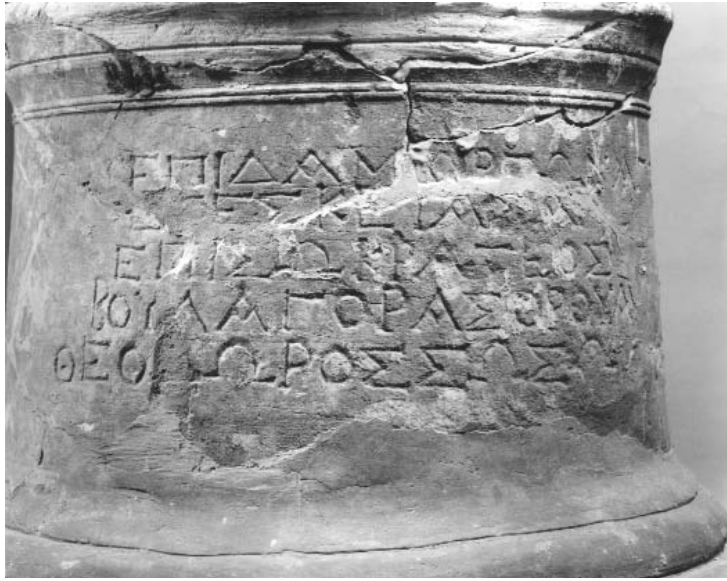
Figura 4: Inscripción 2.B (1).