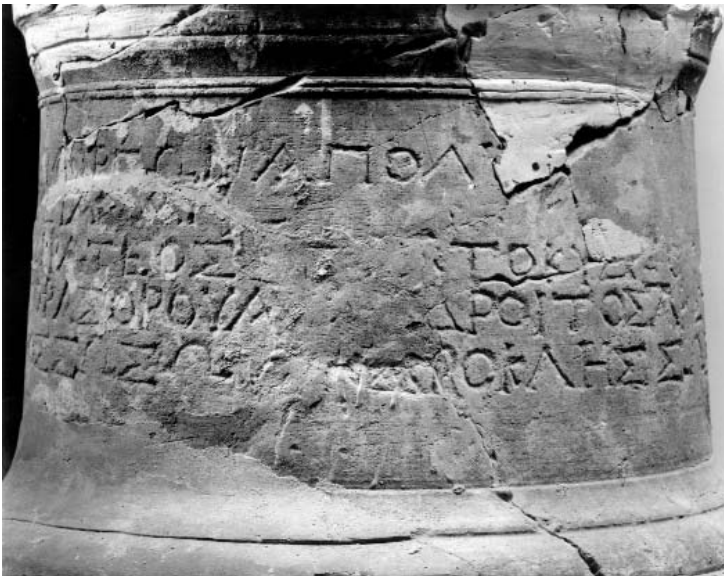
Figura 5: Inscripción 2.B (2).