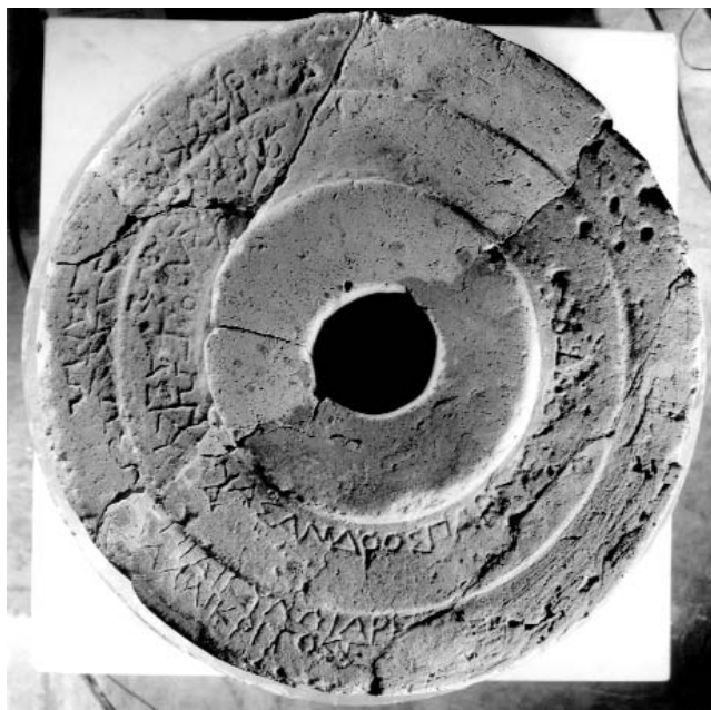
Figura 2: Inscripción 2.A.