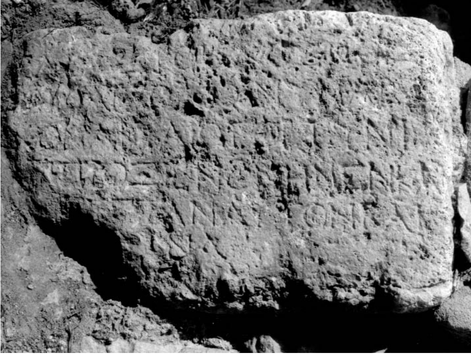
Figura 1: Inscripción 1.