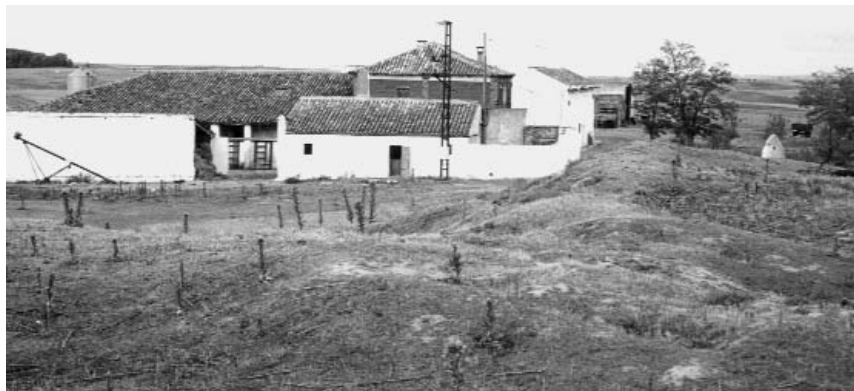
Foto 10. Mayorga de Campos (Valladolid). Villalógán: Mota del Castillo y finca.

O en la exención de la jurisdicción del merino real por parte del rey Alfonso X en el año 1257 71 :