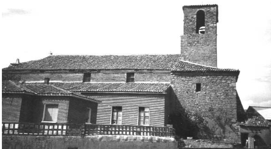
Foto 2. Cabrerros del Monte (Valladolid). Iglesia de San Juan Bautista.