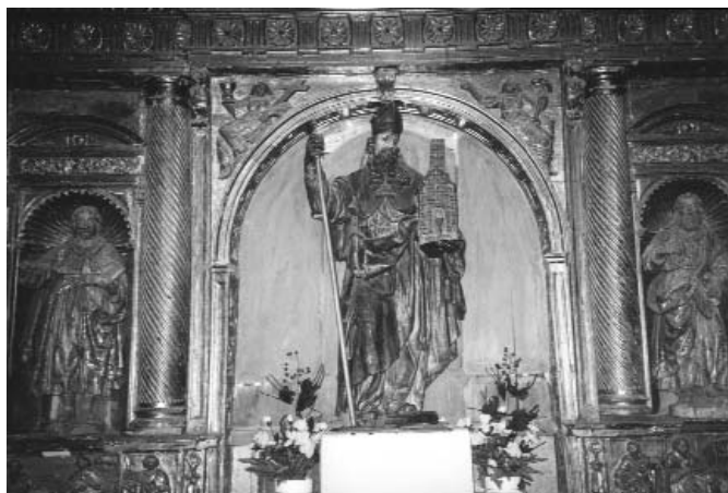
Foto 3. Cabrerros del Monte (Valladolid). Retablo de San Agustín.