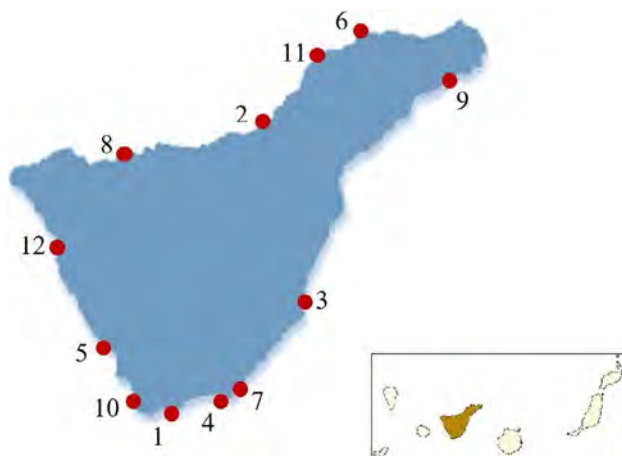
Figura 1. Áreas de estudio de la isla de Tenerife. 1. Las Galletas, 2. Playa Jardín, 3. Porís de Abona, 4. La Tejita, 5. Caleta de Adeje, 6. Punta del Hidalgo, 7. El Médano, 8. Playa San Marcos, 9. Las Gaviotas, 10. El Palm-Mar, 11. Finca El Apio y 12. Playa de Los Gigantes.