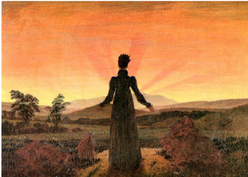
Mujer ante la salida del sol. Oleo sobre lienzo, 22 x 30cm.

Nace en Greifswald; Dresde, 1774-1840, fue el principal representante de la pintura romántica alemana. Su obra gira en torno a la grandeza de la naturaleza frente a la insignificancia del hombre.