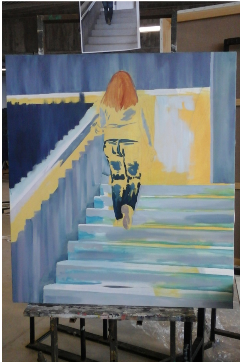
Técnica Mixta, (acrílico, óleo sobre lienzo).

En esta obra hizo el azar que las partes inconclusas llamaran mi atención, por lo que me decidí a dejarlo inacabado y empecé a reflexionar sobre el lenguaje pictórico que quería utilizar. Por ello puedo decir que éste es el origen de mi creación y queda incluido en el total de las obras presentadas en este proyecto.