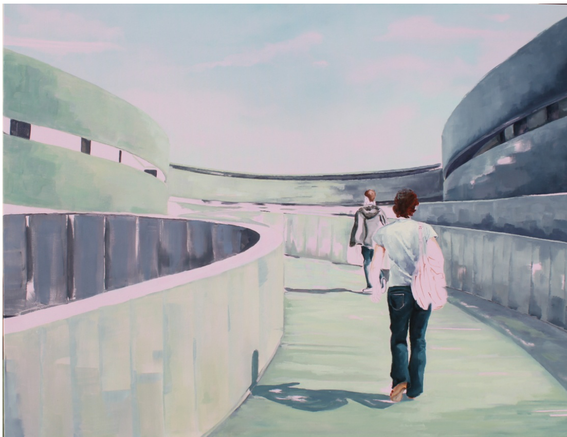
In Situ I

Técnica Mixta (acrílico/óleo sobre lienzo)