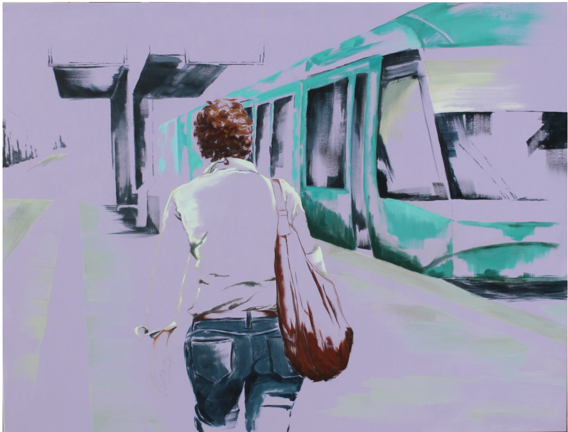
In Situ III

Técnica Mixta (acrílico/óleo sobre lienzo)