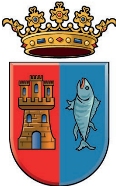
Escudo Conil de la Fra.