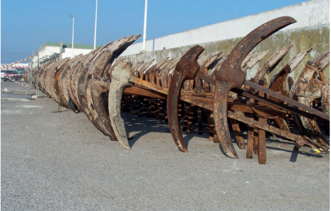
Anclas de almadraba.

La pesca del atún mediante este sistema se remonta a la antigüedad prerromana y lógicamente ha evolucionado a lo largo del tiempo, dando lugar a distintos tipos de almadraba, principalmente la de tiro o vista , la de monteleva y la almadraba de buche .