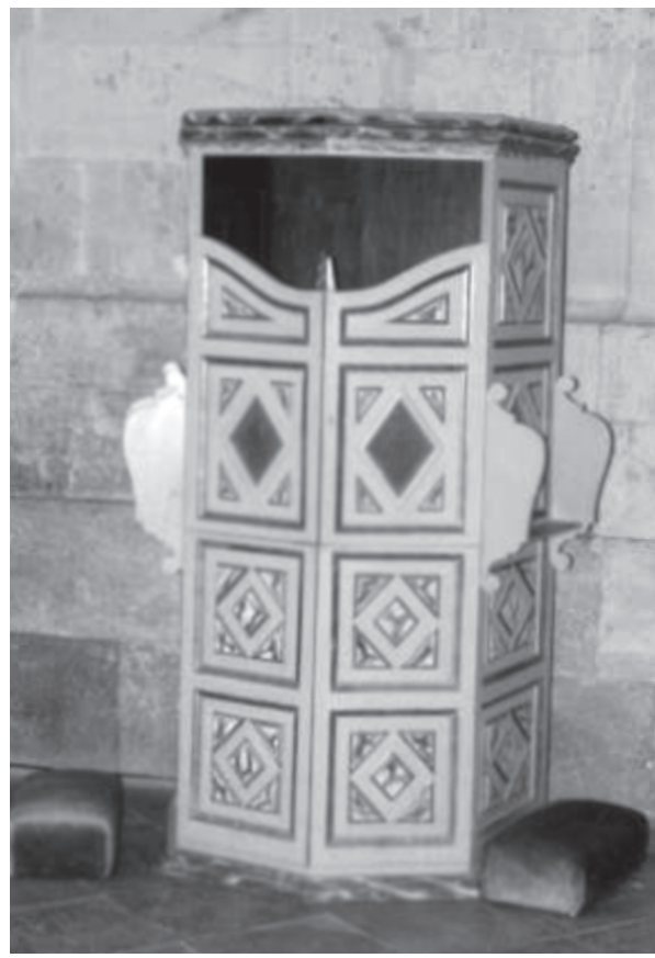
Confesionario de la iglesia de la Purísima Concepción, Salamanca. Escenario propiciatorio para el galanteo y la seducción.