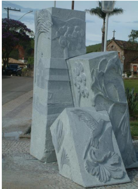
Obra de Maribel Sánchez (España)