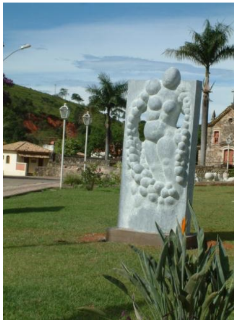
Obra de Liliva Povornikova (Bulgaria)