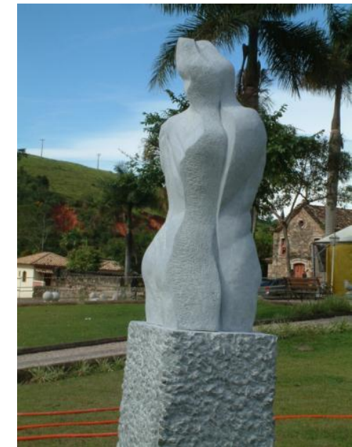
Obra de Agnessa Ivanova (Bulgaria)