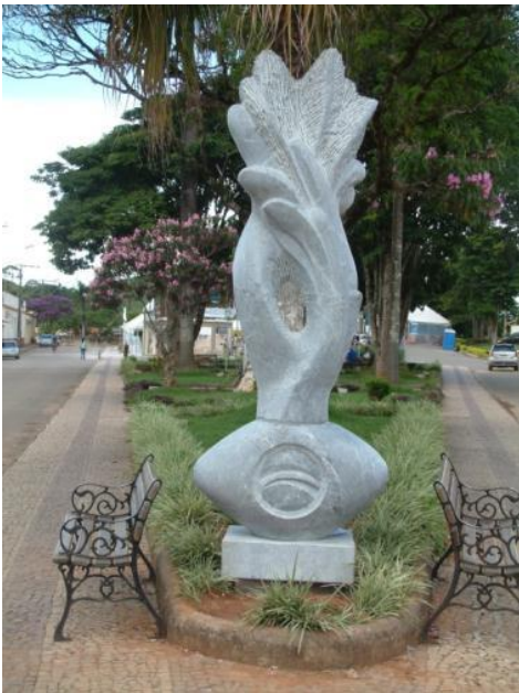
Obra de Petro Matl (Ucrania)