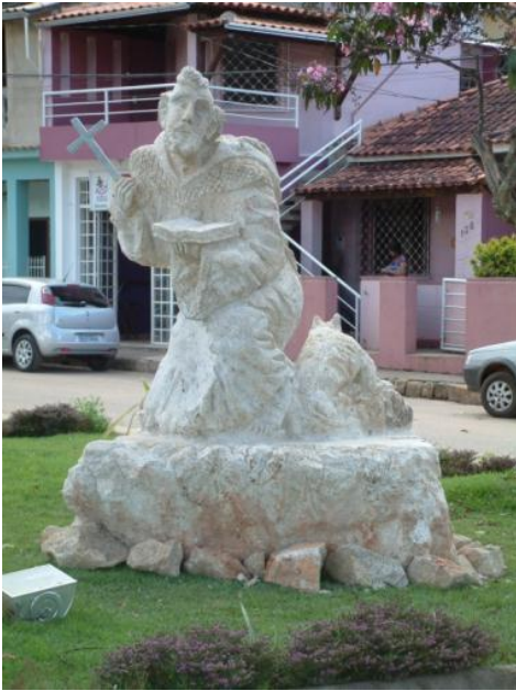
Obra de Francisco Sales (Brasil)