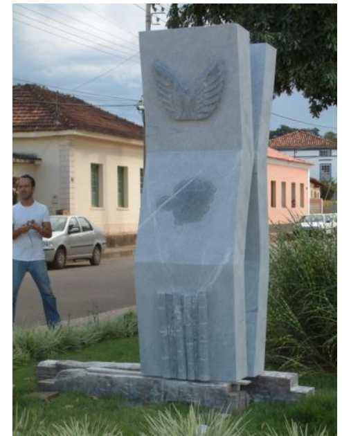
Obra de Víctor Reig (Portugal)