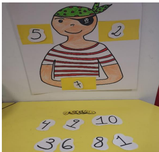
Imagen 1. El pirata de las matemáticas.

Se creó un material manipulativo que el alumno no estaba acostumbrado a utilizar, este es un pirata hecho en una cartulina, con sus monedas y los números del 1 al 10 (ver imagen 1).