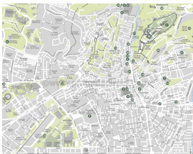
Ilustración 2 Plano de Granada.

Finalmente, cabe destacar la adquisición por parte de la UNESCO del título de Patrimonio de la Humanidad en el año 1984 de sus lugares más hermosos: la Alhambra, Generalife y Albaicín. Estos se encuentran situados en dos colinas adyacentes, donde el Albaicín y la Alhambra forman el núcleo medieval de la ciudad de Granada, donde domina la ciudad moderna. De hecho, en la parte este de la fortaleza y residencia real del conjunto de la Alhambra, se encuentran los maravillosos jardines del Generalife, la casa de campo de los emires que dominaron la parte musulmana de España entre los siglos XIII y XV. Además, el barrio del Albaicín conserva un rico conjunto de construcciones de carácter hispanomusulmán que se mezclan de una manera armónica con la arquitectura tradicional andaluza.