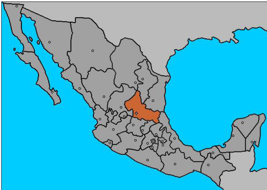
Imagen 1. Ubicación geográfica de San Luis de Potosí .

La categoría preferencial que goza Real de Catorce se manifestó en el anuncio que la Secretaría de Turismo hizo a finales de 2004, cuando dio a conocer que para 2005 se invertirían 4.3 millones de pesos en la localidad, con el objeto de “preservar la belleza y el misticismo de un pueblo espectacular”. Entre otros rubros, estos recursos se emplearían en la rehabilitación de la red de agua potable, apuntalar el túnel de Ogarrio, el cual permite el acceso