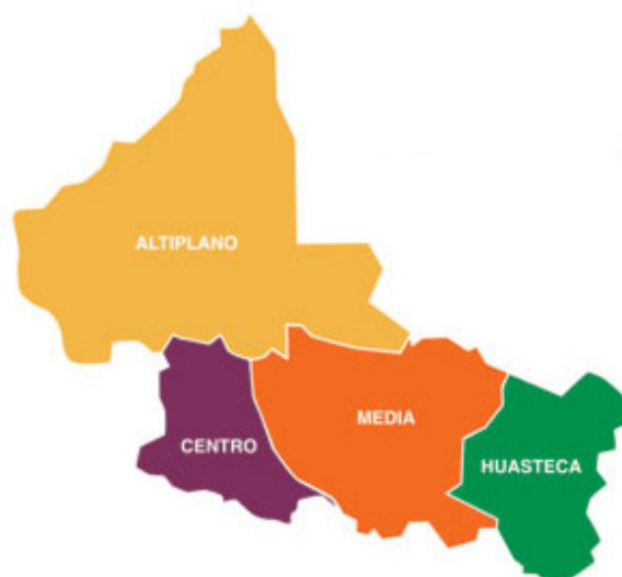
Imagen 2. Localización de las 4 regiones que conforman el territorio potosino.

al desarrollo de oportunidades para poder impulsar el desarrollo humano a nivel individual y a nivel de las comunidades. Sin embargo, los recursos y el potencial que puedan tener las regiones y algunas de sus localidades requieren desarrollar un intenso proceso de seguimiento y monitoreo de todos los aspectos que se encuentran involucrados en la puesta en marcha de estos proyectos. Es decir, se hace necesario relacionar los recursos naturales-ambientales con los intereses económicos, los intereses políticos de los agentes locales y de los agentes extralocales (Rangel Valadés, Norma Lucero 2011; Pineda Manzano, Ulises 2010).