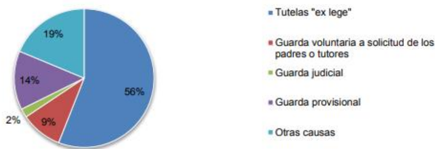
Figura 1. Motivos de ingresos en residencias. Dirección General de Servicios para la Familia y la Infancia, 2017, pág.24.

En España en el año 2016, se mostró el porcentaje más alto de motivo de ingreso en residencia de menores por tutela “ex lege” con un 56% como se expone en la figura siguiente: