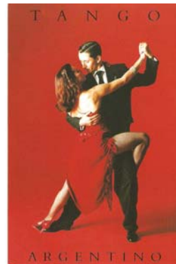
Fotos 6 y 7: Ejemplos de tematización y escenificación aplicadas al tango.