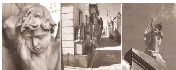
CEMENTERIO DE LA RECOLETA - BUENOS AIRES - ARGENTINA