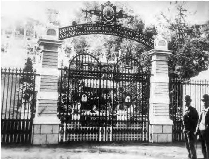
Fig. 6. Acceso a la exposición desde la plaza de la Constitución.

La muestra sirvió de marco excepcional para la arquitectura efímera. A ella se accedía desde dos entradas, una en la calle León y otra junto a la plaza de la Constitución, a través de una rampa y una escalinata diseñada para la ocasión por el citado Nicandro González Borges. La entrada principal era la situada en la plaza y en ella se colocó una bella portada flanqueada por dos pilares rematados por sendos jarrones y una verja con el título Exposición de Horticultura , diseñada por Felipe Machado y Benítez de Lugo y en la que podían admirarse una palmera y un drago 70 . Estaba inspirada en los arcos de entrada de las recientes exposiciones universales y una vez traspasada, un paseo con pequeños lagos y cascadas daba acceso a una rampa que comunicaba con el jardín y que estaba presidida por un gran kiosco de madera para la música (fig. 6). La muestra se estructuraba en extensos parterres, amplias rampas y elegantes kioscos para ciertas instalaciones privadas. Estaba dividida en cuatro secciones: plantas útiles y de adorno; flores y ramos; frutas, legumbres, horta-