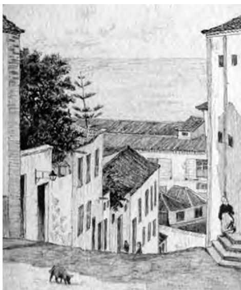
Fig. 11. Dibujo de la calle Cóloman de La Orotava (detalle). George Derville Rowlandson, 1893. Colección particular, Londres.

superponen sus terrazas todas cubiertas con una gruesa alfombra de vegetación» 106 . Una visión que compartirán otras personalidades llegadas a la isla, bien como simples viajeros, bien con otros fines más concretos (fig. 11).