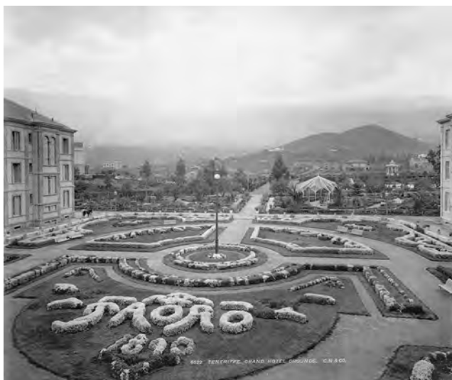
Fig. 7. Jardines del Hotel Taoro. Fotografía de Carl Norman, 1893. En la esquina superior derecha puede apreciarse el kiosco de los coleus ya colocado y detrás la iglesia anglicana.

siones al estilo inglés, es decir, que, traspasada una primera zona ajardinada geométricamente, situada frente al hotel, los visitantes se adentraban en un entramado de lugares que con el tiempo y el crecimiento de la arboleda se transformaron en espacios de sorpresa en los que el malpaís sobre el que se había diseñado se dejaba ver y en los que se podían encontrar los kioscos comprados al Ayuntamiento de La Orotava o la iglesia anglicana de All Saints, levantada en 1890 bajo las líneas del neogótico inglés y perfectamente integrada en los jardines del hotel 91 (fig. 7).