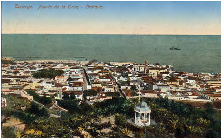
Fig. 9. El kiosco de los helechos ya reubicado, con el Puerto de la Cruz como telón de fondo.

de los helechos, que parece haber sido cambiado de ubicación, ya que nos lo encontramos en la parte norte, con el Puerto de la Cruz como telón de fondo, en fotografías algo posteriores (figs. 8 y 9). Todos ellos debieron desaparecer cuando la zona del Taoro comenzó a urbanizarse y los usos del hotel cambiaron.