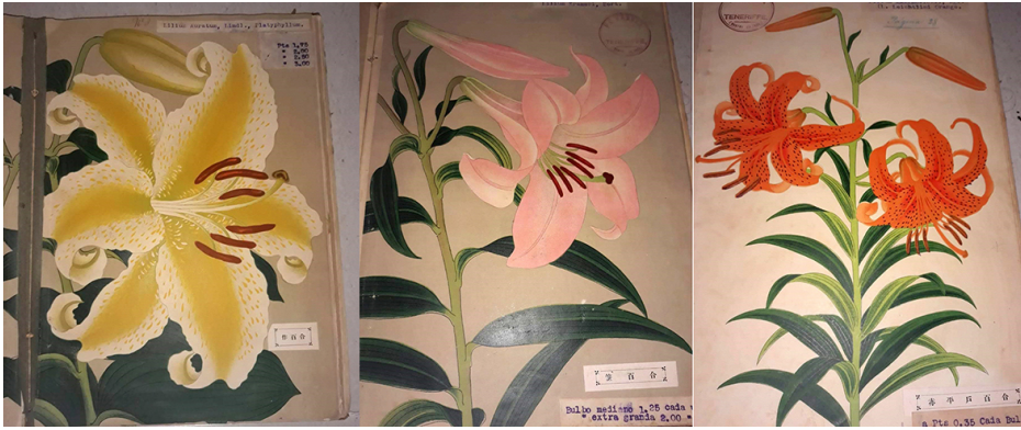
Fig. 2. Detalles del catálogo de lirios japoneses de Federico C. Varela. Colección particular.