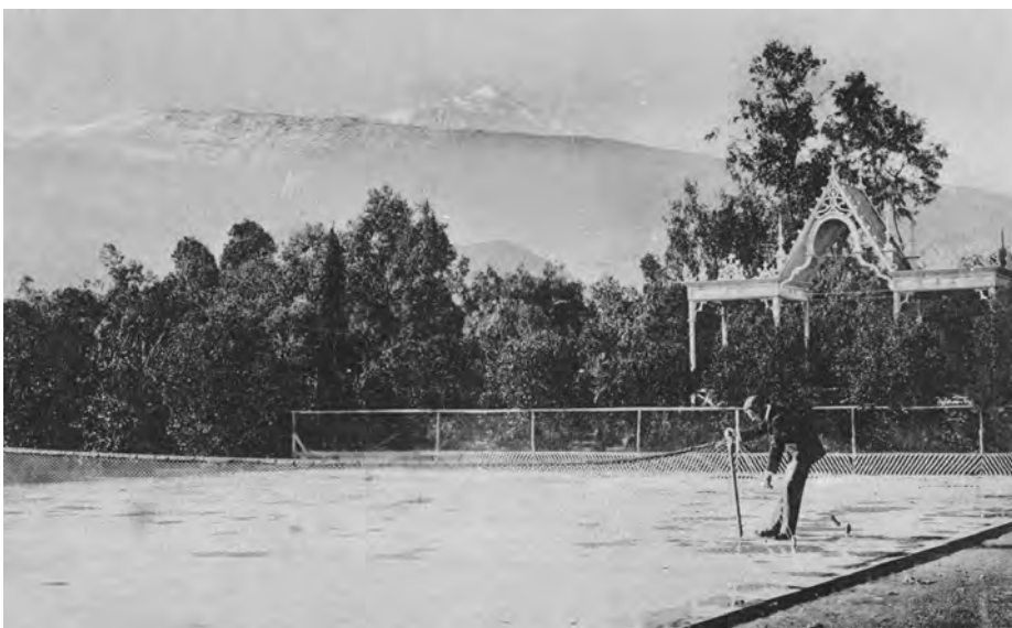
Fig. 14. Kiosco de frutos del país junto a la cancha de tenis de los jardines del Hotel Taoro, c. 1910.

música, se situaba en un promontorio a la entrada del recinto. Usaremos la denominación siguiente para referirnos a ellos, a partir de la mencionada en el pie de foto del grabado y que también aparece en otras referencias de la época: kioscos de frutos del país, kiosco de helechos, kiosco de los coleus y kiosco de la música. En general, se trata de estructuras bastante sólidas inspiradas en los pabellones usados en jardines ingleses, que utilizan formas de la arquitectura colonial británica en Asia, del mudéjar español o del eclecticismo imperante. Como hemos visto, este tipo de construcciones proliferaron en los inicios de las exposiciones universales y se difundieron a través de ilustraciones en catálogos que recogían formas bastante concretas de elaboración de elementos ornamentales que también sirvieron para la decoración exterior en casas de tipo victoriano. Veamos cada uno de los ejemplos.