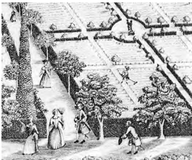
Fig. 4. Detalle de uno de los grabados de los jardines de Franchi.