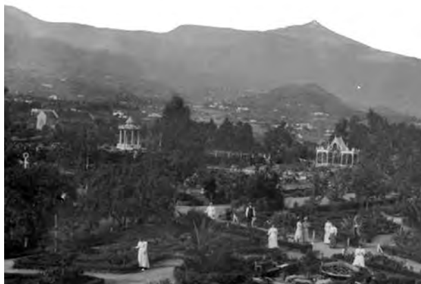
Fig. 8. Jardines del Hotel Taoro. Pueden apreciarse el kiosco de los coleus y el kiosco rectangular de frutos del país.