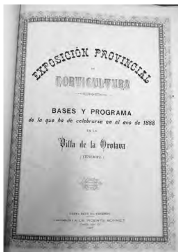
Fig. 5. Portada de las bases editadas en 1887 con motivo de la Exposición Provincial de Horticultura.

veces a las islas a través de curiosos a la vez que interesantísimos catálogos que los arquitectos manejaban para sus creaciones 56 . Estos manuales, conocidos como pattern books , fueron muy populares durante el siglo XIX, convirtiéndose en guías para carpinteros y constructores que incluían técnicas de construcción y detalles de diseño, con alzados y planos que despertaban la curiosidad de la clientela.