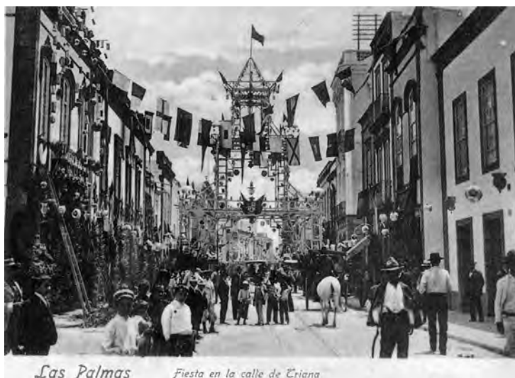
Fig. 10. Arco levantado en la calle Triana de Las Palmas de Gran Canaria, c. 1893.

al trono de la reina Isabel II 104 . Son manifestaciones tempranas del arte efímero asociado al evento circunstancial.