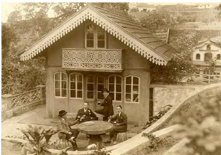
Fig. 16. Antiguos herbarios de la muestra del tipo cottage , ya desaparecidos.

tectónicos, sin olvidar que nació unido al jardín, que fue su razón de ser primera, como lugar de placer en medio de la naturaleza controlada 132 .