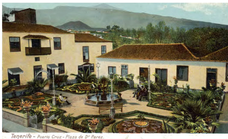
Fig. 3. Tarjeta postal con la plaza de Víctor Pérez, Puerto de la Cruz, c. 1905.

que trajo al arquitecto Adolphe Coquet a Canarias para el diseño del mausoleo de los jardines de la Quinta Roja 32 . La plaza, calificada de «moderna y artística» en su inauguración, se concibió como un rectángulo dividido en cuatro zonas ajardinadas cruzadas por dos caminos perpendiculares y una hermosa fuente central. La vegetación, a modo de parterres, incluía especies canarias, como las altas palmeras que podemos ver en la actualidad. El jardín se cerró con un muro sin verja, de escasa altura y rematado por macetones a lo largo del perímetro. Se le hicieron cuatro accesos, uno en cada lado, donde se colocaron pequeñas verjas, excepto en la entrada principal, en la que se puso una mucho más elaborada que incluyó el nombre del médico y la fecha. En el espacio central, cuatro farolas repetían los modelos decorativos de la reja principal. Formalmente, el cerramiento de la plaza recuerda mucho a las soluciones que desarrollará Estanga para estos espacios.