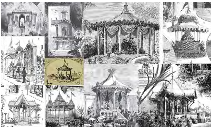
Fig. 15. Distintos modelos de kioscos aparecidos en diversas publicaciones antes de 1888.

en este tipo de kioscos, ya que permitía la escucha y la visualización. Las delgadas columnas facilitaban el desarrollo de estructuras diáfanas y sin ángulos muertos, lo que ayudaba a la expansión del sonido y a que la orquesta, banda o grupo pudiese ser escuchada desde cualquier punto. La cubierta no era muy elevada, pero hacía las funciones de protección de los músicos frente a las inclemencias y al mismo tiempo hacía de caja de resonancia.