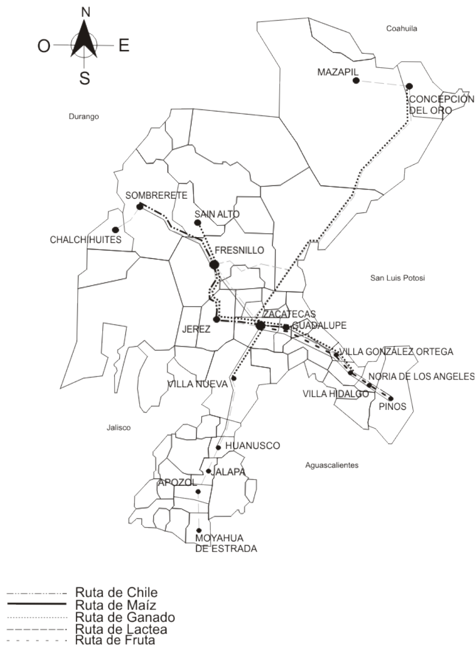
Figura 2. Rutas propuestas para los municipios de Zacatecas

largo del año y adquirir una gran variedad de artesanía como sillas de montar, fustes, deshilados, bordados y prendas piteadas, entre otras objetos (INAFED, 2005b). En tanto el municipio de Tabasco, aporta a la R2l monumentos históricos (portal Hidalgo y portal Jiménez), templos, santuario y asistencia a fiestas regionales, además de la venta de artesanías como morrales, mecates de ixtle, utensilios de barro y bolsas piteadas (INAFED, 2005b). En lo que