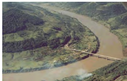
Vista aérea do Goio-En antes da construção da Barragem Foz do Chapecó

Segundo Renk e Savoldi (2009) a relação com a natureza é um dos pontos mais fortemente utilizados para mostrar que os caboclos estariam mais próximos aos “bons selvagens”, em oposição aos colonizadores, que são considerados os respon-