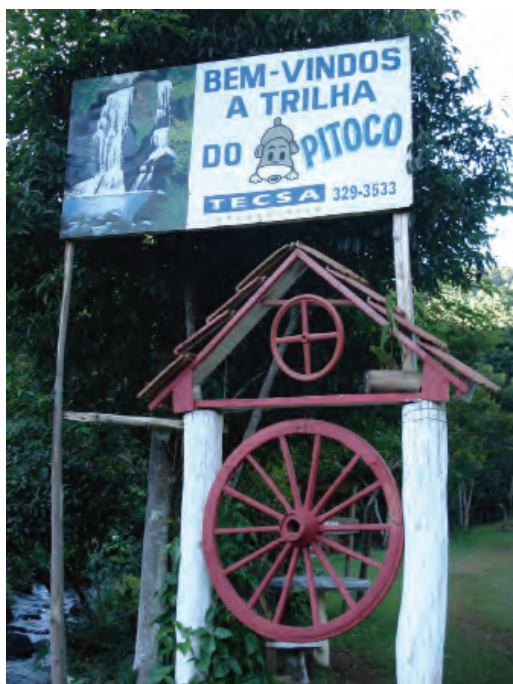
Portal de Boas vindas à Trilha do Pitoco.

caboclo é mais natural, vive sem agrotóxico e veneno. A água que bebe é natural”. Ao invés dos alimentos industrializados valorizam aqueles feitos em casa, recordando do sabor desses, produzidos artesanalmente, como a farinha de beiju fabricada no monjolo ou a farinha de mandioca produzida na atafona. Afiar a faca e foice no rebolo. Cozinhar em panela de ferro. Essa era a alimentação farta e pura dos velhos tempos. Essa vida rústica, vida natural como enfatizam, mostrava que o caboclo enfatizava e enfatiza o natural.