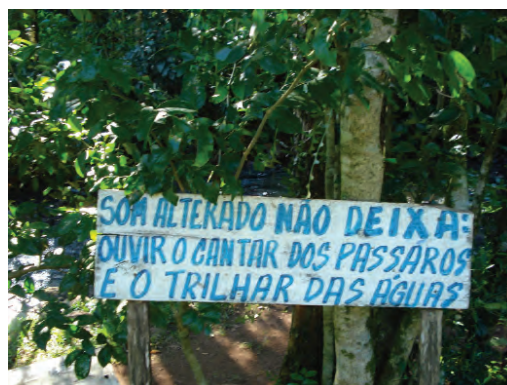
Conselho aos visitantes sobre o comportamento na trilha.

Além do nome da trilha, o Pitoco é também aparece no portal de entrada da trilha, há ainda uma estátua do mesmo no caminho.