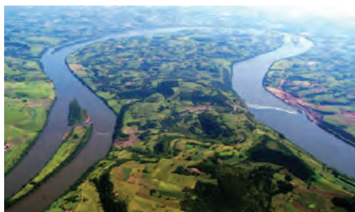
Fotografia aérea da área anterior à construção da Usina Hidrelétrica Foz do Chapecó.

Os caboclos desta região ribeirinha levavam um modo de vida tradicional, de produção agrícola e animal para o auto-consumo e valiam-se da pesca alimentação e eventual venda, de modo informal. Nas décadas mais recentes, houve penetração de descendentes de alemães e ita-