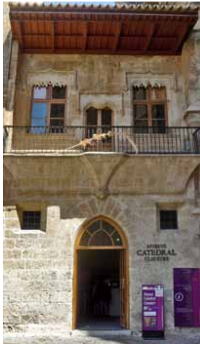
Figura 2. Casa de la Almoína. Entrada actual al Museo Capitular

Además del museo capitular, instalado durante su mandato, Pere Joan Campins, obispo de Mallorca entre 1898 y 1915, tuvo la iniciativa de crear un museo arqueológico diocesano para el estudio y la difusión de la historia y de los bienes legados por nuestros antepasados. Alrededor de 1906, resolvió reconstruir unas dependencias del huerto del Palacio Episcopal, que estaban en muy mal estado, con la idea de establecer allí el museo. Esta reforma, que fue encargada al arquitecto diocesano Guillermo Reynés, finalizó a principios de 1908. Día 9 de febrero del mismo año, en un discurso pronunciado con motivo del VII centenario del nacimiento del rey Jaume I, organizado por la Comisión Provincial de Monumentos, el obispo anunció públicamente su voluntad de crear un museo ligado a la diócesis. 30