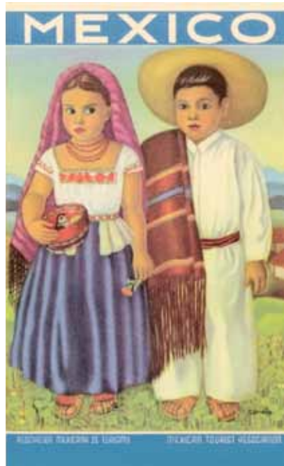
Imagen 3. Vestimenta tradicional.