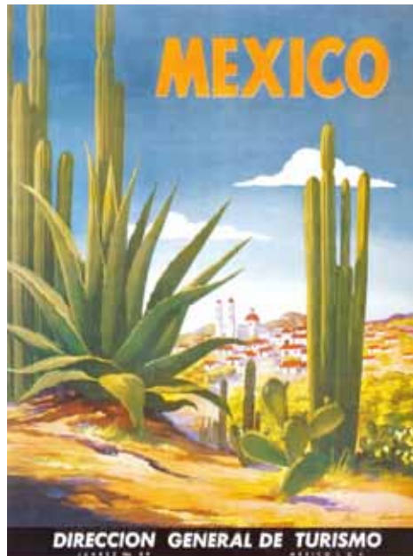
Imagen 4. Paisaje rural.