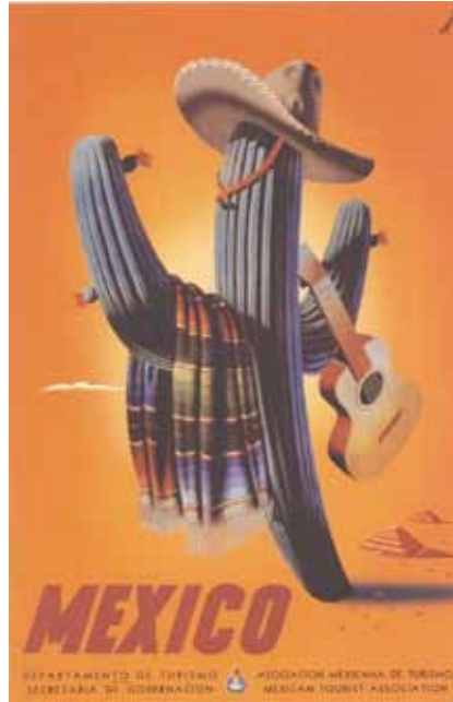
Imagen 5. Composición de atributos.