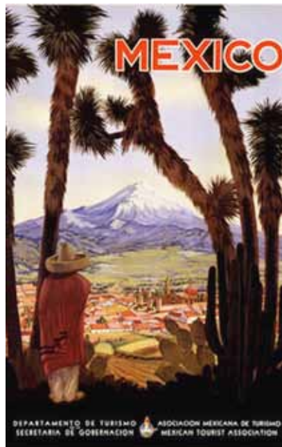
Imagen 6. Paisaje rural.