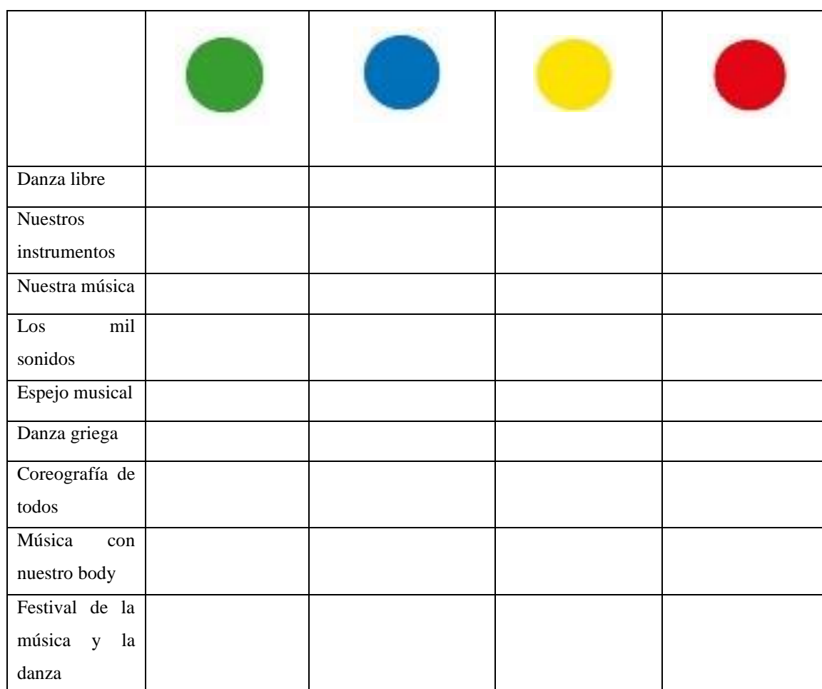
Tabla para el alumnado