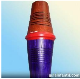
Figura 1: Maraca reciclada