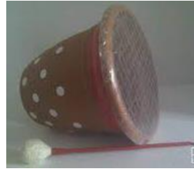
Figura 2: Tambor reciclado

Material: Vasos de yogurt reciclados, cola, cinta adhesiva, arroz, macetas, papel albal, palillos chinos, cartulina, colores y apoyo de las familias.