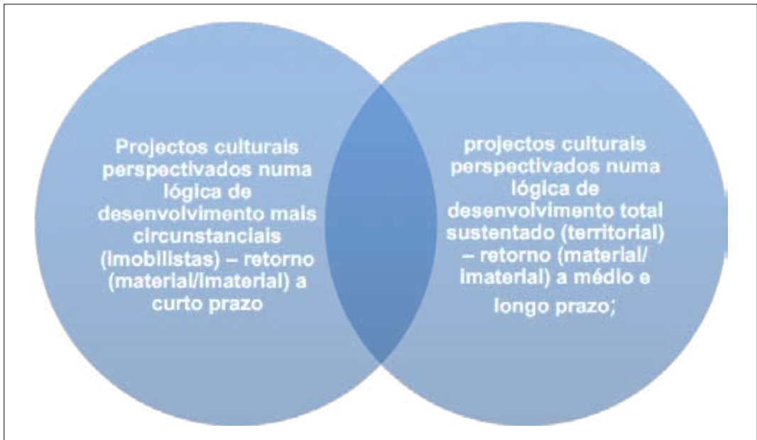
Figura V. Desenvolvimento Circunstancial vs Desenvolvimento Sustentado