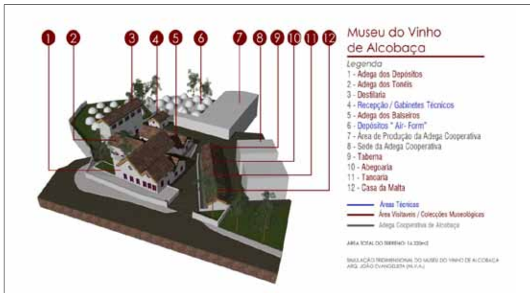
Figura I. Planta Tridimensional do Museu do Vinho de Alcobaça