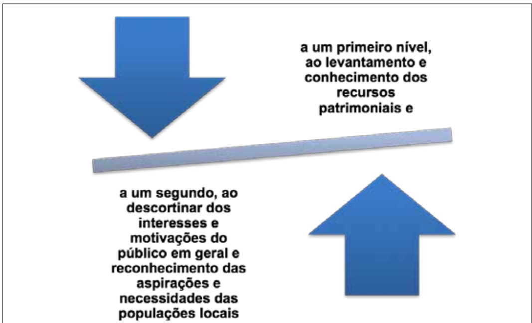
Figura VI – Balanço dos Recursos Endógenos [Recursos Patrimoniais e Motivações Locais]

Como se depreende do exposto anteriormente, o investimento no património obriga sobretudo ao assumir de uma política integrada, isto é, de articulação de políticas centrais ou locais com as políticas sectoriais. Esta possibilidade implica, por sua vez, posições simétricas de âmbito regional e local de valorização cultural do património (centros históricos, bairros culturais, museus de território ou ecomuseus, ruínas legíveis, paisagens interpretadas, etc.), fortalecendo quer a sua relação com o território, quer associando uma oferta turística (produto cultural) diversificada, assente em redes (de equipamentos), eventos culturais regulares e projectos de itinerância. Um programa de acção desta natureza obriga a dois níveis de equilíbrio estabelecendo o balanço dos recursos endógenos: