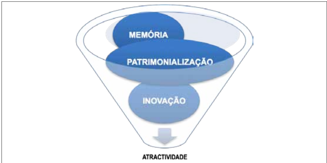
Figura IV. Esquema da Atractividade Cultural

recursos, de bens e indústrias culturais), quer como indutor de outros factores, igualmente intangíveis, criadores de bem-estar social, progresso cultural e prosperidade económica. Parte do pressuposto que o património e as indústrias criativas, bem para além da simples criatividade associada à gestão de ideias, geram condições internas e externas positivas que se estendem da patrimonialização da memória à promoção da noção de inovação e atractividade cultural: