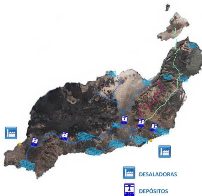
Foto 3. Infraestructura correspondiente al sistema de distribución de agua potable de las islas de Lanzarote y La Graciosa.

El proceso de desalinización no solo separa las sales no deseadas del agua, sino que además elimina iones que son esenciales para el consumo y, a su vez, para el crecimiento adecuado de cultivos (Yermiyahu et al. 2007).