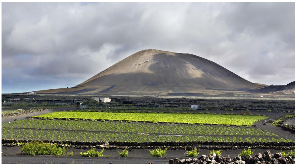
Foto 1. Arenado artificial cultivado en el municipio de Tinajo. (Agrolanzarote, 2012)

Los arenados (o enarenados) se definen según el Diccionario de Canarismos como “Sistema de cultivo que consiste en cubrir de forma permanente el terreno con una capa de arena volcánica para conservar la humedad de la tierra, diferenciando en Lanzarote entre arena y rofe según el tamaño de la arena volcánica, siendo más fino en el primero” (Academia Canaria de la Lengua, 2019).