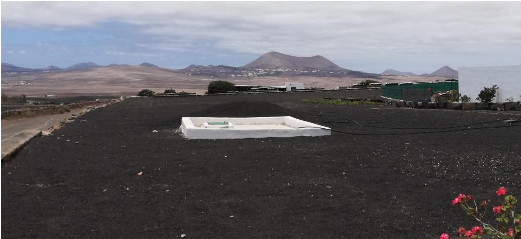
Foto 2. Aljibe como recurso hídrico convencional para el consumo doméstico en La Villa de Teguiise, municipio de Teguiise.

El sistema de cultivo en secano ofrece una baja productividad, que junto con el incremento del turismo, varias décadas atrás, ha provocado el abandono de estos agrosistemas y su consecuente deterioro. Además, el incremento del sector del turismo, dio lugar a la búsqueda de nuevos recursos hídricos no convencionales que pudieran abastecer al número cada vez mayor de personas que llegaban a la isla. Dichos recursos hídricos no convencionales empleados hasta hoy día son, el agua de mar desalinizada y las aguas residuales regeneradas (Tejedor et al., 2011). Con estos nuevos recursos, se retoma la actividad agrícola, aunque no como actividad principal en la economía de la isla, sino complementaria a la de otros sectores económicos. Así, se van implantando gradualmente nuevos sistemas de riego que van sustituyendo la técnica de agricultura en secano. El uso del riego se irá aplicando a los cultivos tradicionales en Lanzarote, como por ejemplo batatas, papas, tomates, hortalizas e incluso en viñas, aunque en este último caso aún no es muy común (Tejedor et al., 2011).