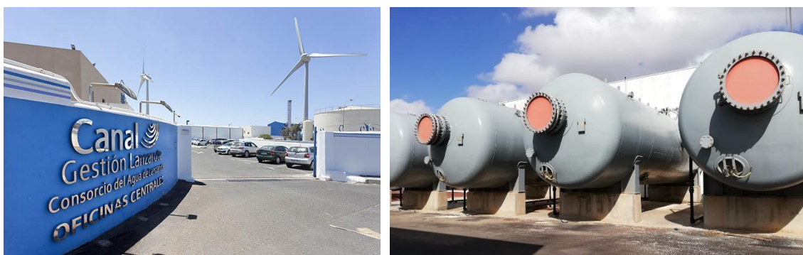
Foto 5 (der.). Instalaciones de la remineralizadora en la Central de Desalación Díaz Rijo.