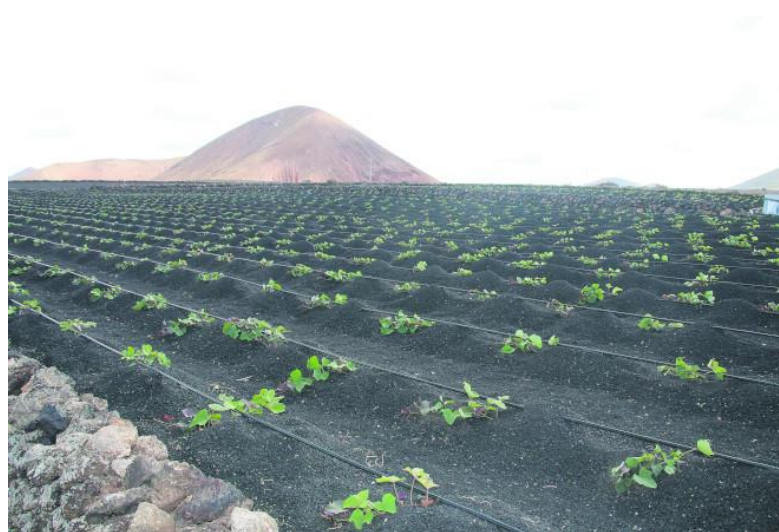
Foto 7. Cultivo de batatas en arenado con sistema de regadío en el municipio de Tinajo (Agrolanzarote, 2019).