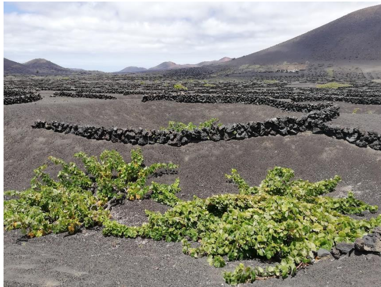
Foto 6. La Geria, arenados con cultivos de vid, ejemplo de cultivo de secano (Masdache, municipio de Tías)

En varios de los estudios que se han tenido en cuenta para este trabajo, muchos de los suelos analizados se clasifican como Haplocambids , con régimen arídico (donde se incluyen suelos típicos de las regiones áridas y semiáridas) a údico (suelos de climas húmedos con distribución regular de la precipitación anual favoreciendo los procesos de lavado (Tejedor et al., 2011).