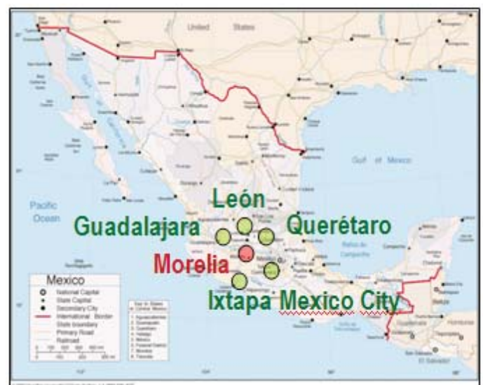
Figura 2. Ciudades cercanas a Morelia, Michoacán