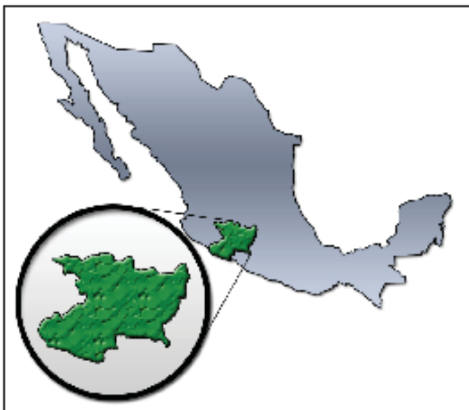
Figura 1. Ubicación del Estado de Michoacán

Todos estos elementos posicionan a Michoacán como un estado con un gran potencial y atractivo turístico. Prueba de ello, y como se establece en el documento “Tu-