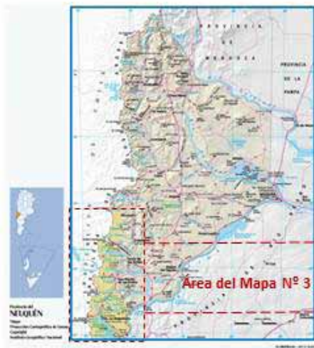
Mapa N° 2: Provincia de Neuquén