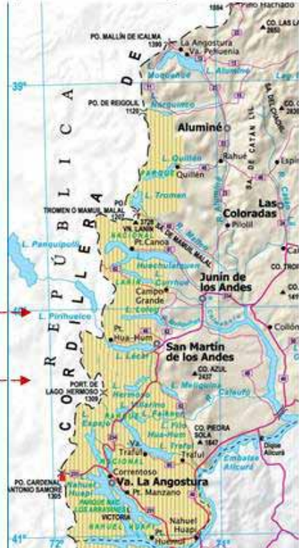
Mapa N° 3: Corredor de los Lagos de la Provincia de Neuquén