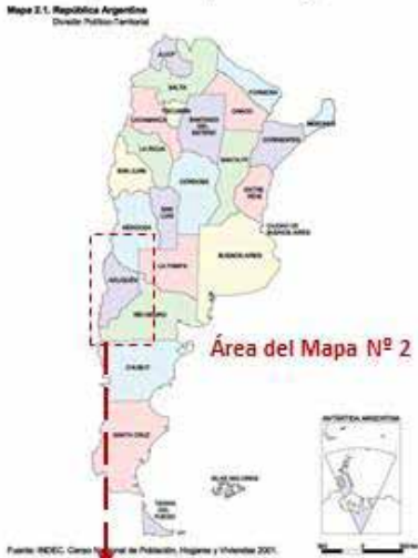
Mapa N° 1: República Argentina