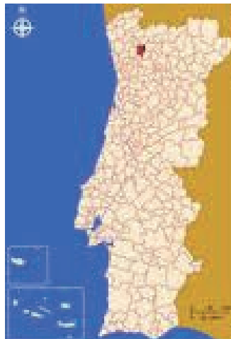
Figura 1: Localização da RPI