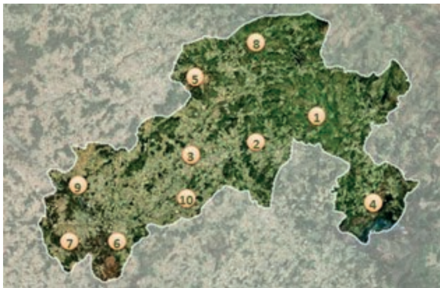
Figura 2: Rota do Património Industrial do Vale do Ave