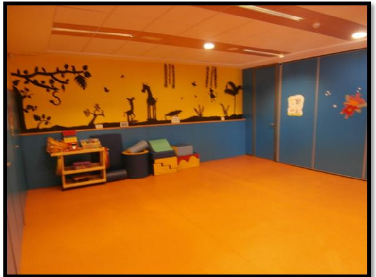
Aula de psicomotricidad