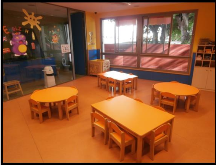
Aula de 2 años