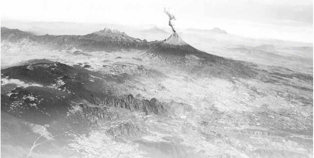
Imagen 1: Foto Aérea de Tepoztlán, Instituto Nacional de Estadística y Geografía (INEGI), 2011.

tema central dentro de la era de la información, la conectividad y la tecnología globalizada, de modo que su integración solo puede ser de manera programada, esto si no queremos dejar a la población referida cada vez más “desconectada y desigual” (García-Canclini, 2004).