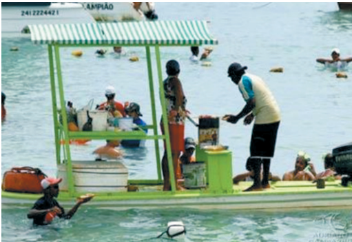
Figura 4. Comercialização de alimentos e bebidas (23/01/2009)