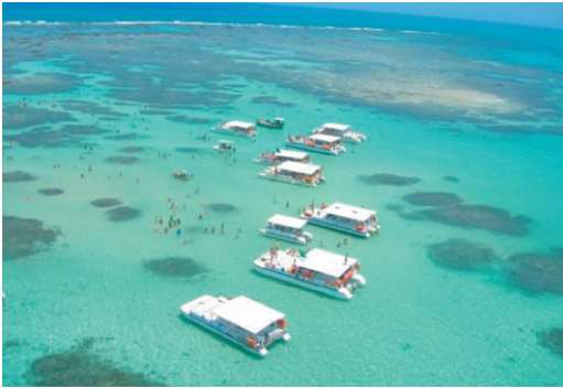
Figura 2. Exploração turística das Galés de Maragogi