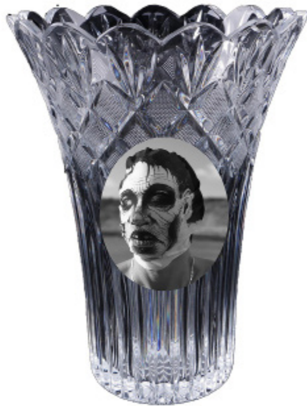
Jarrón de la Gran Vía 1. [Composición fotográfica.].(2019).

Suelen transitar por capitales importantes, donde el Non Stop lo marca las agujas de las compras y del gasto, en la búsqueda de experiencias mientras rellenan los horas del día. Se reconocen porque son iguales, como una copia tras copia, zombi tras zombi, seres en abundancia que transitan por las ciudades, en ese fluir salvaje de la mercancía. Y así, van depositando ticket en sus vidas, relleno sus almas cual florero del 3 al 4. Se conforman con la satisfacción primaria del momento.