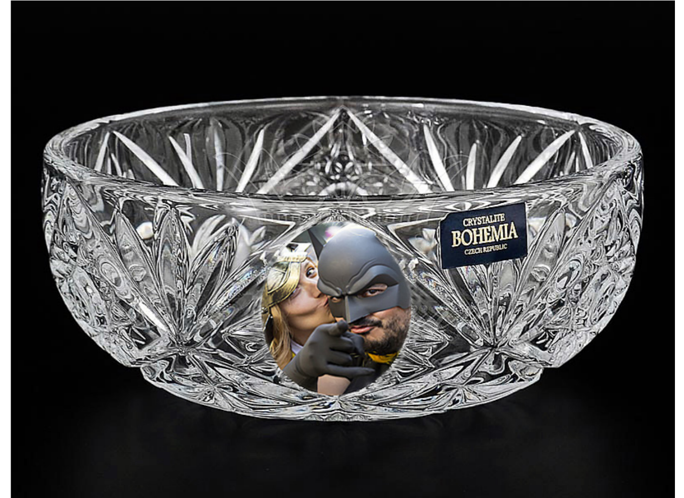
Centros de Bohemia, El bueno y el malo. [Composición fotográfica]. (2019).