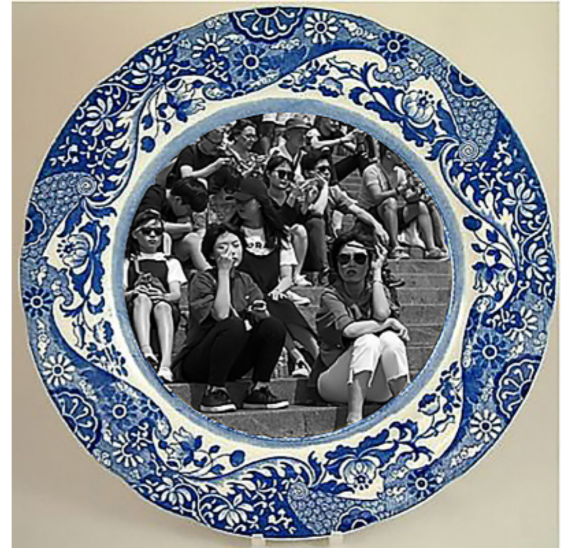
Souvenir Sacre Coure. [Composición fotográfica].(2019).

Siguen el tránsito del capital, la cultura aceptada y la no pérdida de divisas del sistema.