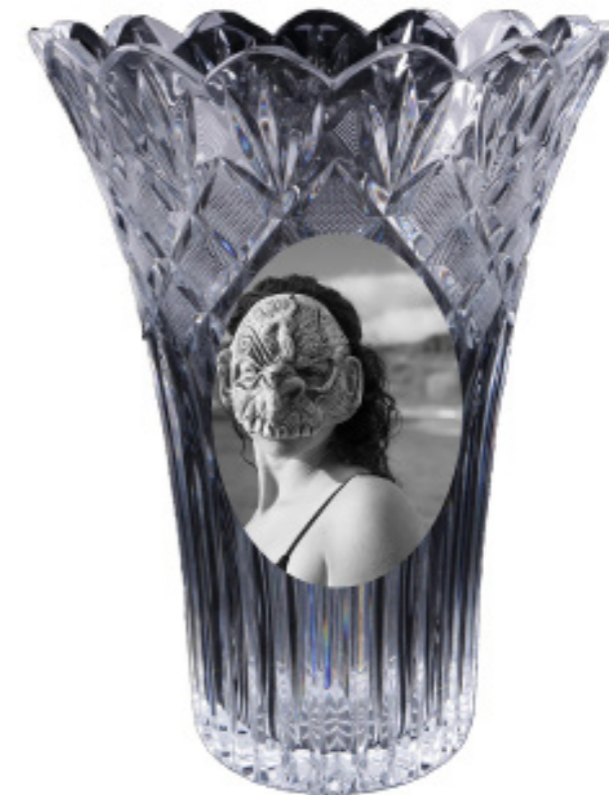
Jarrón de la Gran Vía 2. [Composición fotográfica.].(2019).