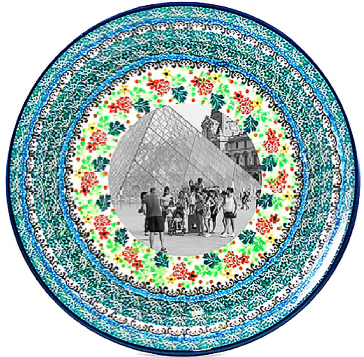
Souvenirs Louvre. [Composición fotográfica.].( 2019).