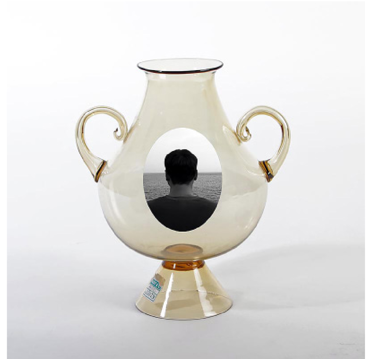
Jarrón de cristal.[Composición fotográfica]. (2019).

¿Cómo podemos construir subjetividades sostenibles?