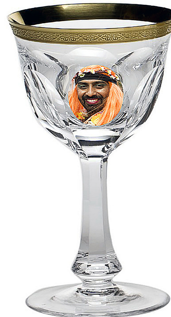
Copa de Bohemía. [Composición fotográfica]. (2019).

nas”, que por febrero toca su festividad. Es un tiempo donde la anarquía se adueña de las formas. Durante esos días, los partícipes toman las calles y se liberan ríos de libertad a son musical. Los seres libremente interpretan su disfraz, liberan las tensiones acumuladas en el orden social cotidiano y se relaja el cuerpo de las contracturas anuales. Música y diversión, componentes necesarios para la emancipación momentánea del pueblo. Nadie se reconoce en el juego de reconocer. ¿A ver si adivinas quién soy? Si nos remontamos al origen de la tradición del Carnaval este es incierto. No obstante, la mayoría considera que el Carnaval se remonta a festividades paganas que realizaban los romanos en honor al dios Baco.