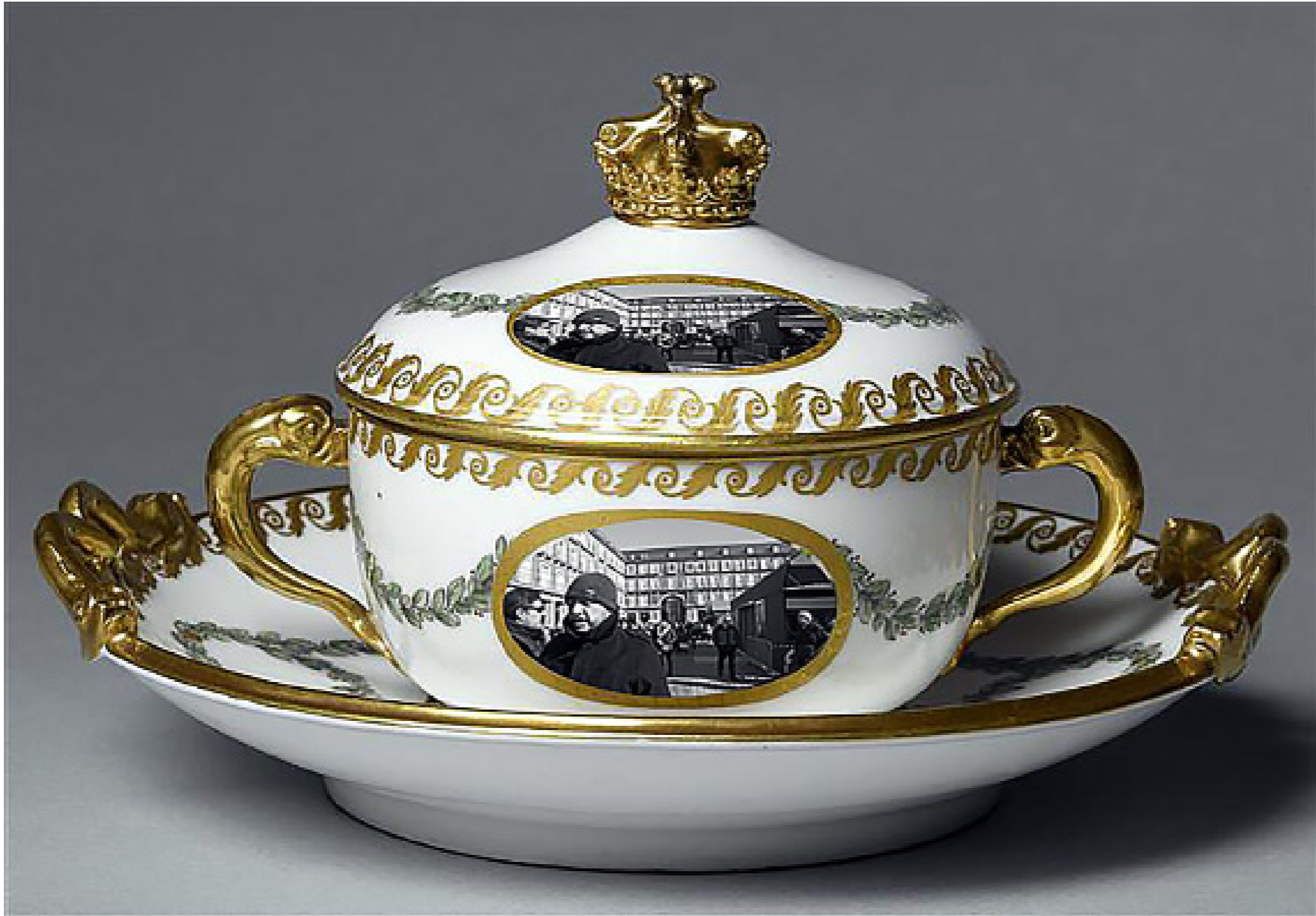
Sopera de Humanidades. [Collage fotográfico]. (2019).