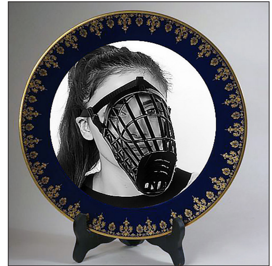
Platos de porcelana. [Composición fotográfica]. (2019).