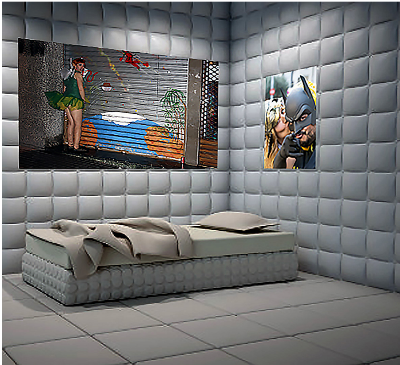
Paredes blancas.[Instalación digital].(2019).