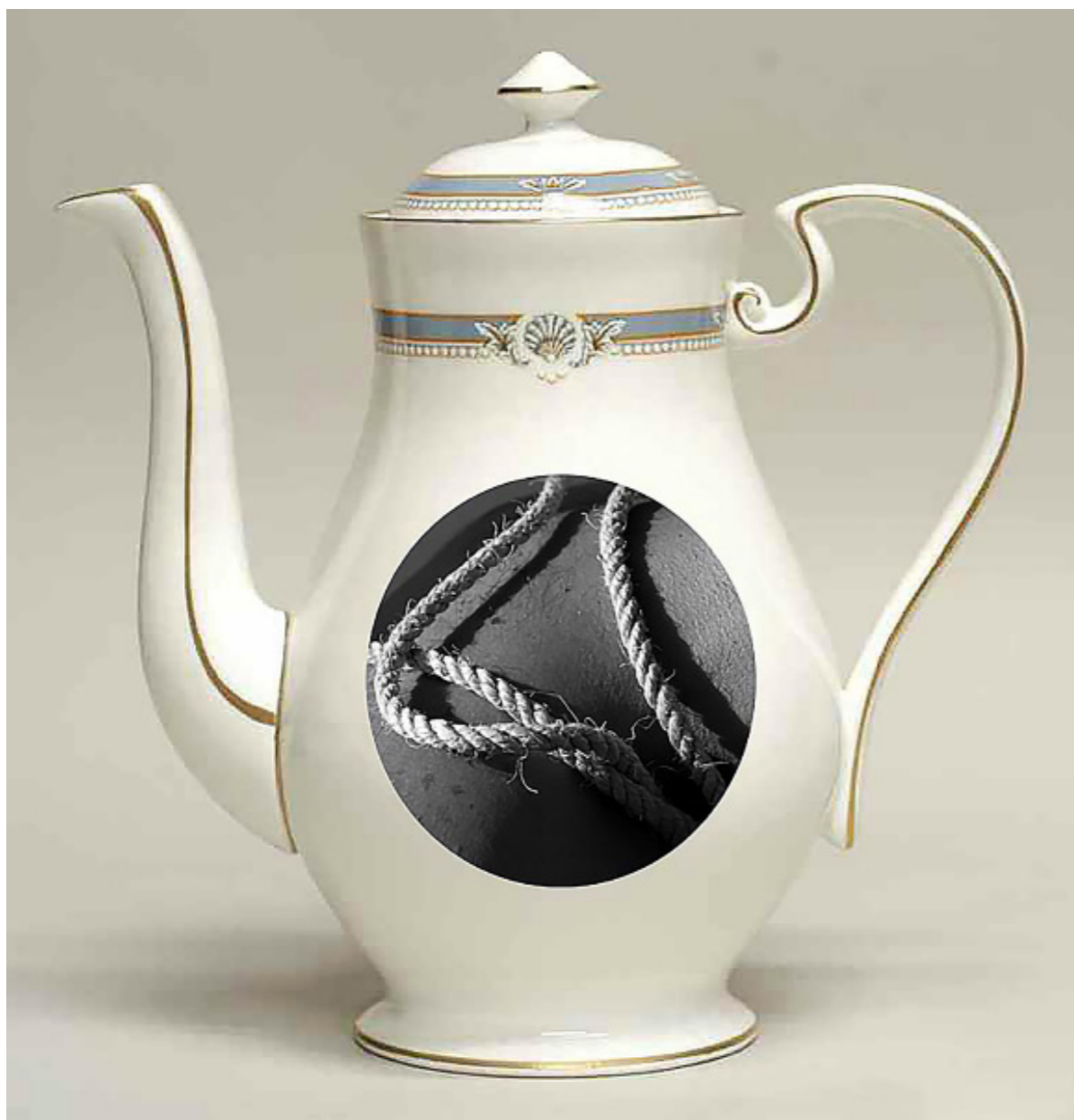
Tetera de porcelana. [Composición fotográfica].( 2019).

En este proyecto fotográfico trabajo el concepto de tribu urbana como deriva de un mercado actual; un sistema de mercado donde la materia principal no son los objetos en sí, sino la necesidad de poseer. Existe la brutal necesidad de consumir, de gastar, de cambiar, de rellenar una vida, que a priori parece vacía; una vida de aceptación social y felicidad aparente.