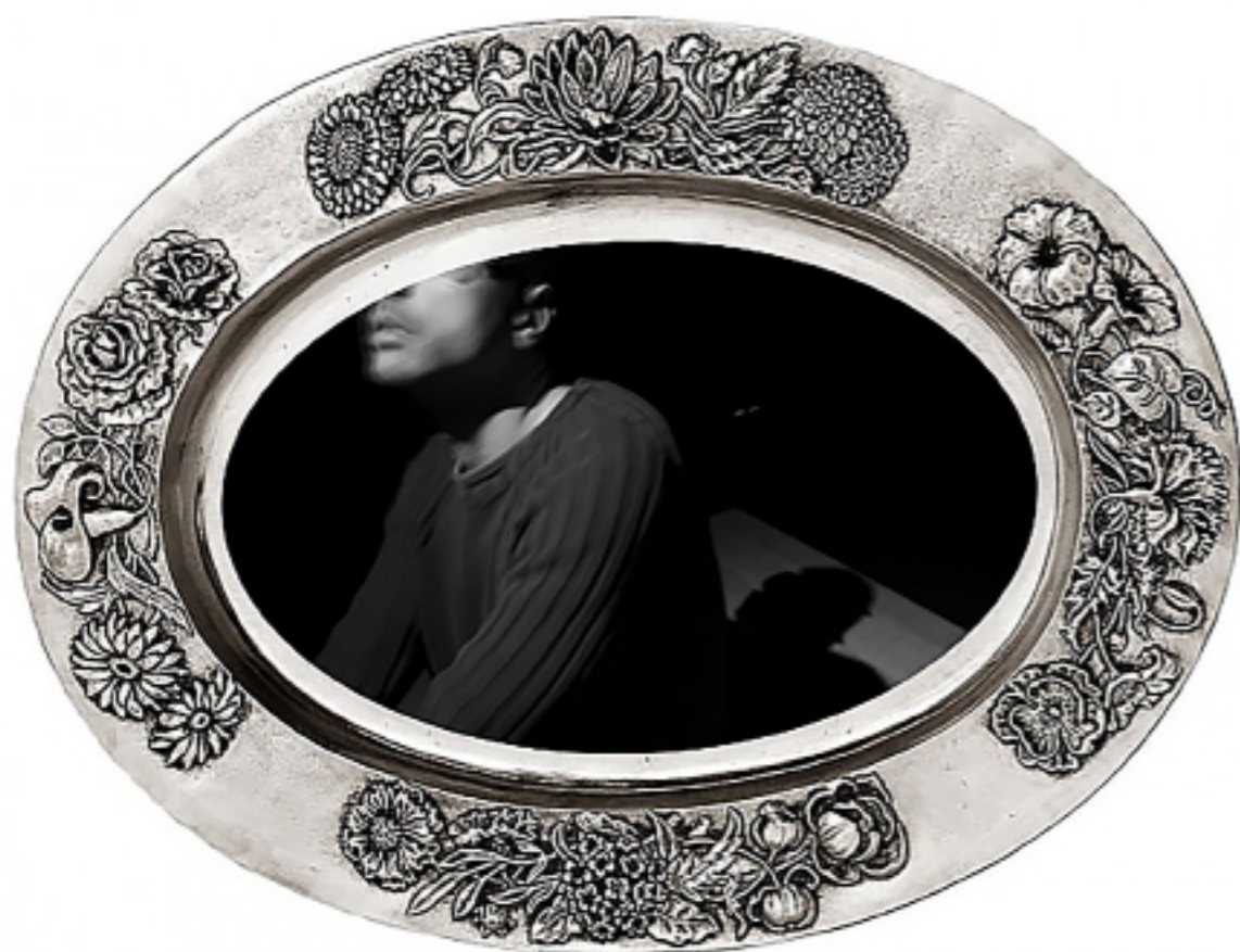
Bandeja oval. [Composición fotográfica.Tríptico].( 2019).