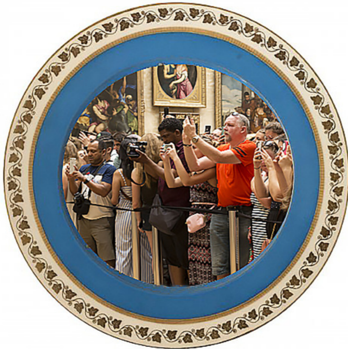
Souvenirs Mona Lisa. [Composición fotográfica.].( 2019).