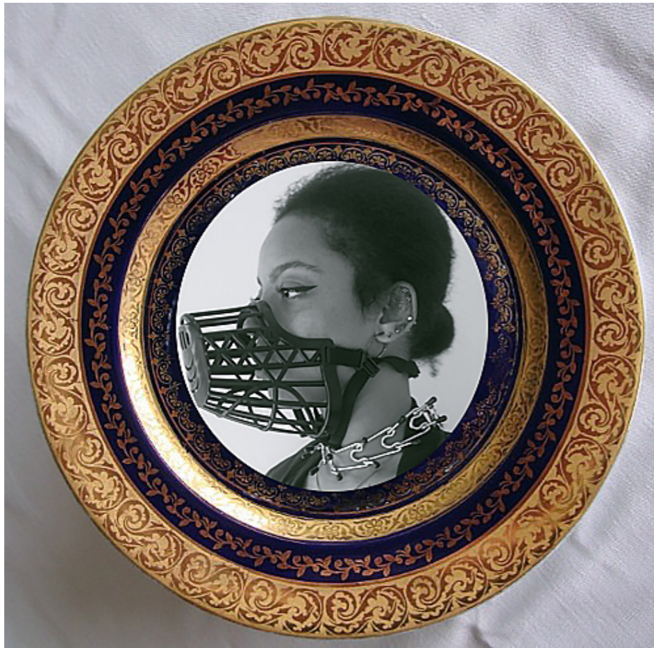
Platos de porcelana. [Composición fotográfica]. (2019).

Nuestro deber es analizarlo, observar sus puntos débiles e intentar modificarlo con el único propósito de que funcione mejor para todos.