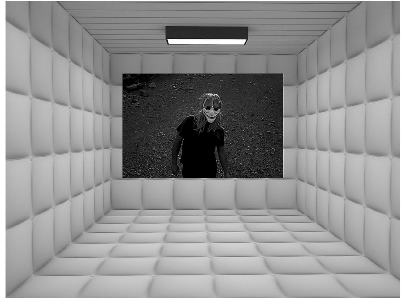
Paredes blancas[Instalación digital]. (2019).