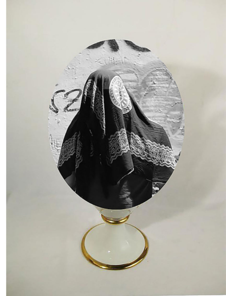
Copas Nocturnas. [Composición fotográfica. Díptico]. (2019).