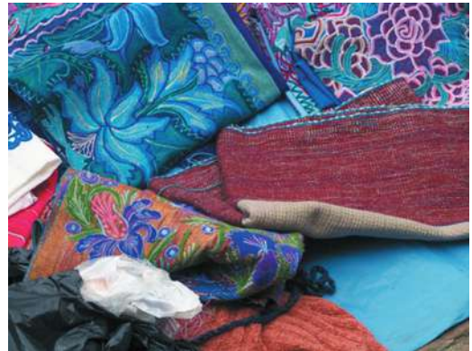
Figura 1. Textiles indígenas

Las mujeres confeccionan una amplia gama de textiles desde los trajes típicos de cada comunidad indígena hasta manteles y servilletas, cojines, colchas, tapetes y caminos de mesa con diferentes diseños, bordados e hilos de colores. El traje indígena incluye para las mujeres faldas largas, huipiles o blusas bordadas, cinturones, chales o rebozos, las cuales varían de un municipio a otro, han ido cambiando con el paso de los años y han devenido parte de la identidad indígena femenina de la región. Al contrario de la mayoría de los hombres que únicamente utilizan algunas prendas ceremoniales en los rituales comunitarios, las mujeres indígenas, sea por imposición, para resaltar su origen comunitario, para diferenciarse, como resistencia, o medida de opresión de los mestizos, han utilizado un tipo de vestimenta que las caracteriza como indígenas. Algunas prendas se producen de forma manual y otras a máquina, en talleres familiares o industriales, al por mayor y al detalle, se repiten diseños o se innovan nuevos, con figuras geométricas o naturales, utilizan brocados o bordados con hilos naturales o sintéticos, se convierten en prendas cotidianas, en vestidos ceremoniales, en el ajuar de huipiles y mantos sagrados de sus vírgenes y santos, o sencillamente acaban siendo convertidas en mercancías para la venta. El traje indígena así juega con múltiples significados y ha pasado de ser un estigma y perteneciente al indio colonial