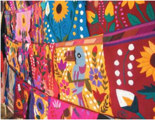
Figura 15. Textiles para la venta. Zinacantán

Así, lo que parece a primera vista una producción artesanal y a pequeña escala, es en realidad un complejo entramado de redes informales que se forman entre diferentes tipos de actores sociales que construyen redes, alianzas y competencias diversas. El mercado turístico permite una demanda continua de mercancías que, a menor escala, también son consumidas por la población femenina indígena. Los significados de estos atuendos por parte de las mujeres indígenas están adquiriendo un sentido de estatus y pertenencia; en las localidades rurales refieren a un resignificación del traje tradicional, mientras en la ciudad se asocian a una forma combinada