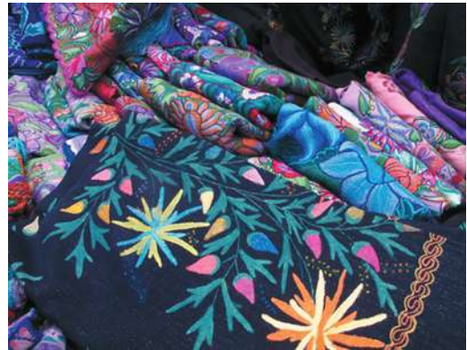
Figura 12. Nuevos modelos de textiles zinacantecos. San Cristóbal de las Casas

Las desigualdades económicas entre los indígenas se manifiestan entre los que sobreviven de una precaria economía informal insuficiente para la subsistencia y los que controlan algunas esferas económicas y han podido subir en la escala social y económica. Las organizaciones internas de los inmigrantes han sido la base fundamental para capturar algunos de los espacios urbanos y las más poderosas son las que controlan el transporte y el comercio urbano. Entre ellos se encuentran los comerciantes que venden artesanías al aire libre y los que tienen puestos de venta fijos en los mercados municipales. 17 Estos espacios comerciales se han convertido en verdaderas áreas de disputa entre indígenas y ladinos en su intento por conseguir el control de la venta. Hoy en día la zonas más solicitada para el comercio de artesanías son las que rodean las iglesias de Santo Domingo y la Caridad, y el mercado municipal José Castillo Tielemans para la venta de alimentos y otros enseres. Ambos espacios han sido intento de desalojo varias veces, algunos de forma violenta, por parte de las autoridades por la presión que reciben de los coletos que pretenden limpiar la zona de indígenas y recuperar el control comer-