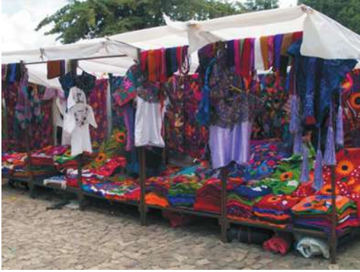
Figura 6. Puesto de venta en Santo Domingo. San Cristóbal de las Casas

parte no se han quedado atrás y han abierto nuevos negocios para ofrecer servicios a los turistas como restaurantes, cafeterías y hoteles, algunos de lujo y a precios desorbitados para los turistas extranjeros. Hay que tener en cuenta que no toda la población de la región participa por igual de este beneficio turístico y que se han producido luchas encarnizadas por ocupar diferentes nichos laborales en el transporte, comercio y servicios turísticos entre otros. Han aparecido nuevas élites empresariales y redes que se han extendido entre indígenas rurales y urbanos o entre inversionistas extranjeros y ladinos o indígenas que aprovechan la oportunidad turística para crear negocios y tomar nuevas posiciones sociales. En este panorama competitivo, las agencias locales buscan ofrecer mejores precios o innovar rutas para el turista, los indígenas explotan su imagen tanto en la ciudad como en los municipios circundantes permitiendo acceder a rituales, ceremonias y casas particulares, se ofrecen nuevos servicios de terapias alternativas y curaciones tradicionales y se apuesta por lo más barato y también lo más exótico. Es el mundo mercantilizado de bienes y servicios para el turismo, pero también el mundo de la escenificación en el que se compete por ser protagonista, sobrevivir y conseguir el mayor capital posible.