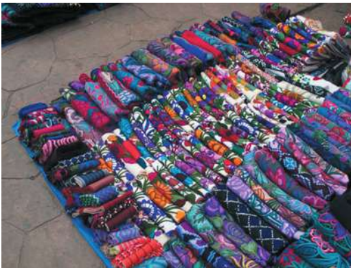
Figura 13. Fabricación y venta al por mayor. San Cristóbal de las Casas

En el mercado de artesanías de Santo Domingo, las mujeres indígenas que se dedican a ser vendedoras se abastecen de mercancías en lugar de producirlas. Los ritmos de venta dependen de las estaciones turísticas, con una mayor afluencia en verano, en Navidad y Semana Santa. Los productos los consiguen en talleres familiares como los de Zinacantán