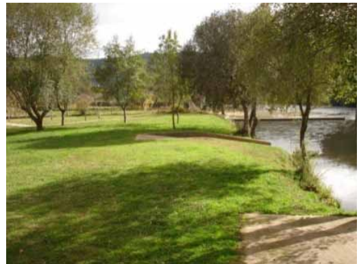
Figura 4. Parque fluvial e barco de rio tradicional

A aldeia de Janeiro de Cima está enquadrada num ambiente natural, com destaque para o rio Zêzere, tendo uma longa tradição na construção de barcos de rio, localmente designadas por “barcas” (Figura 4). O parque junto ao rio é um espaço de destaque na aldeia, atraindo muitos turistas no verão, assim como a realização de eventos.