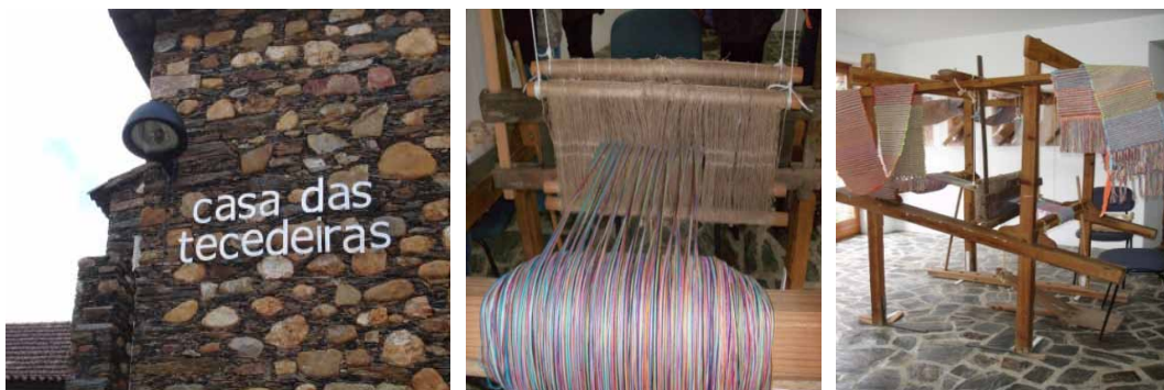
Figura 5. Casa das Tecedeiras