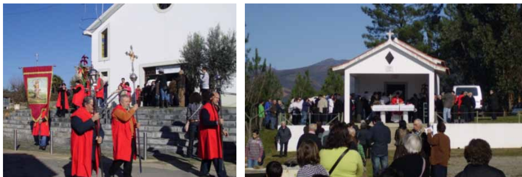
Figura 6. Festa de São Sebastião, em 2011