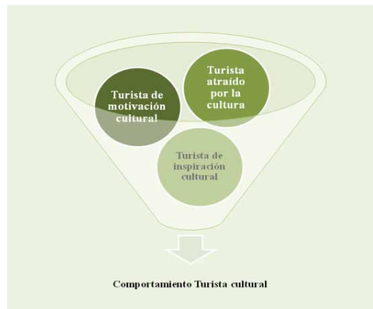
Figura 1: Comportamiento del turista cultural basado en la clasificación de Jansen-Verbeke (1997). Adaptación y elaboración propia (2013).