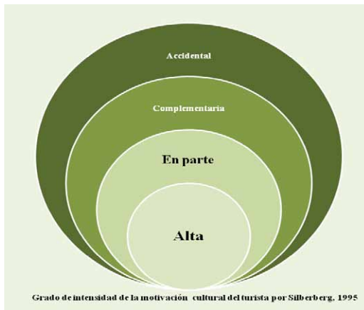
Figura 2: Grado de intensidad de la motivación cultural del turista, según la clasificación de Silberberg (1995).

A través de una figura concéntrica Silberberg, nos muestra: