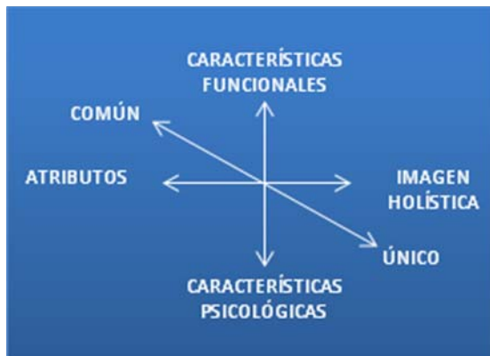
Figura 1. Dimensiones de la imagen de un destino.

la obtención de los datos cualitativos se suelen integrar los resultados de investigaciones previas (Haahti y Yavas, 1983; Boivin, 1986), y la opinión de expertos en turismo. Por su parte, el enunciado de las preguntas que se utilizan para medir los componentes holísticos y únicos de la imagen de los destinos son los siguientes: