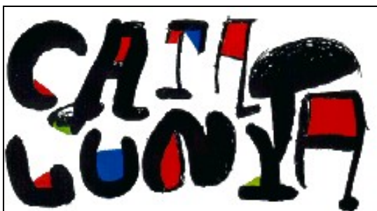
Promoción: Logo Catalunya, Miró.