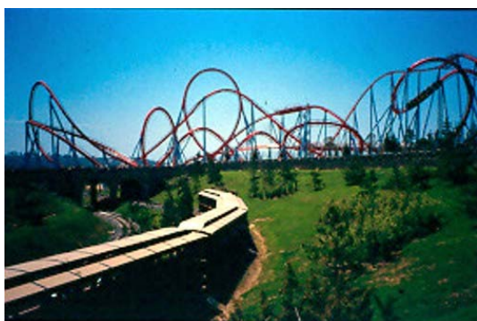
Foto 2. Port Aventura, Salou. Costa Dorada.

en manos de capital local, aunque manteniendo el nombre y con ambiciosos proyectos), ha sido un activo muy importante, sobre todo para la costa sur de Cataluña. No sólo ha añadido atractivo al destino, sino que ha promovido un incremento del gasto de los turistas ubicados en la Costa Dorada, incluso en otras zonas del país, y ha captado a muchos visitantes autóctonos y de zonas cercanas, con un menor gasto, ciertamente, pero no por ello menos apreciable.