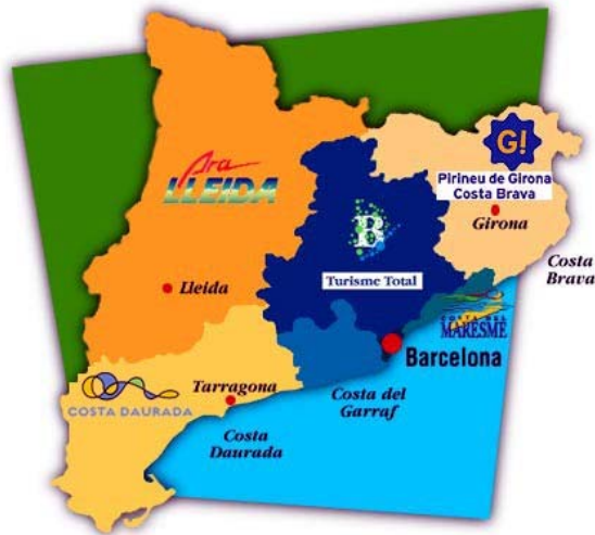
Mapa 2. Mapa promocional.

la cuota de mercado, el volumen de ventas turísticas que se realizan por Internet, no parará de crecer exponencialmente.