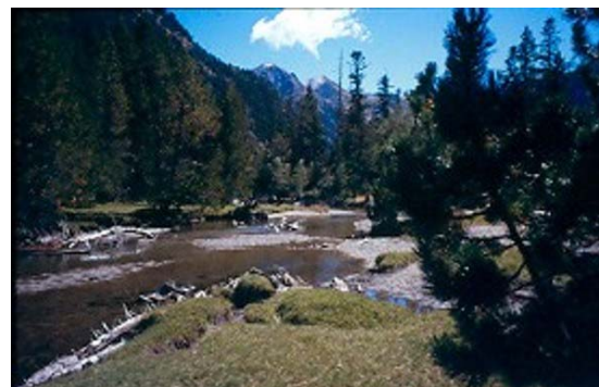
Foto 4. Parque Nacional de Aigüestortes i Estany de Sant Maurici.

El patrimonio, según como se mire (sobre todo el patrimonio natural), es el motivo de compra principal de los productos turísticos pirinenaicos en verano: la belleza del paisaje. En algunos lugares concretos, tiene una capacidad de atracción específica, notable para la zona, como en el caso del Parque Nacional de Aigüestortes i Estany de Sant Maurici. El patrimonio cultural, más que una actividad turística o un motivo de compra específico, en este contexto, continúa siendo sobre todo un elemento del paisaje, como mucho un reclamo promocional. Esto no significa que, en determinadas zonas, recursos especialmente notables del patrimonio cultural, del patrimonio natural, más esquí y turismo activo, permitan desarrollar una oferta localizada de unas dimensiones respetables, como es el caso de Boí-Taüll Resort, una urbanización y complejo hotelero ubicada en el Valle de Boí, que se promociona con el lema de “primer resort de montaña d’Europa”, de dudosa oportunidad, y que se beneficia tanto de las pistas de esquí, como de la proximidad del Parque Nacional de Aigüestortes i Estany de Sant Maurici y del románico del Valle de Boí, declarado patrimonio de la humanidad por la UNESCO, distinción que no representa ventajas económicas directas y sustantivas, pero que permite innegables ganancias promocionales.