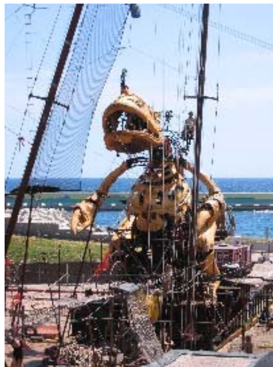
Foto 3. Forum de las Culturas, Barcelona 2004.

También ha creado un importante número de empleos directos (si bien mayoritariamente temporales y poco cualificados), y de bienes y servicios de toda índole. Los retos de Port Aventura son, por una parte, la integración en su entorno turístico, y más ahora, que, con hotejería propia, en la práctica, se ha convertido en un verdadero resort ; por otra parte, Port Aventura plantea el reto de la sostenibilidad del producto en sí mismo, una vez superada la curiosidad inicial, en un contexto turístico relativamente fidelizado, en el cual los visitantes autóctonos han tenido un peso decisivo, con una capacidad de renovación insuficiente para provocar un efecto de repetición a gran escala y con unos hábitos culturales aún muy alejados de la disneyficación del ocio, propia de los Estados Unidos, y que explica fenómenos, que no se dan en Europa, como Orlando o Las Vegas. En este sentido, se puede decir que, en torno al complejo Universal Port Aventura-Universal Mediterrània, se generará un interesante núcleo de observación sobre el modelo de ocio y la globalización, entendida como imposición de modelos culturales.