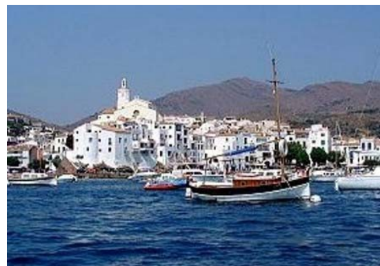
Foto 1. Cadaqués, Costa Brava.